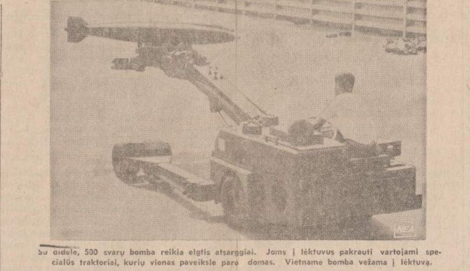
Su oridele, 500 svarų bomba reikia elgtis atsargiai. Joms į lėktuvus pakrauti vartojami specialūs traktoriai, kurių vienas paveikslė parodomas. Vietname bomba vežama į lėktuvą.

Bet brošiūros tekstas parašytas tokiu sachariniškai persaldytu limonadiniu stilium ir tokiu naiviu pagyrūniškumu, kad skaitytojai ar vartotojai tikrai neeis pamiršti, jog tai ne kas kita, o tik valdinė propaganda. Gal tai ir yra pati geriausia brošiūros ypatybė, nes tuo perdėtu pagyrūniškumu ir nepasitikėjimą sukeliančiu sald-liežuviavimu ji pati neutralizuoja galimą melagingą poveikį.