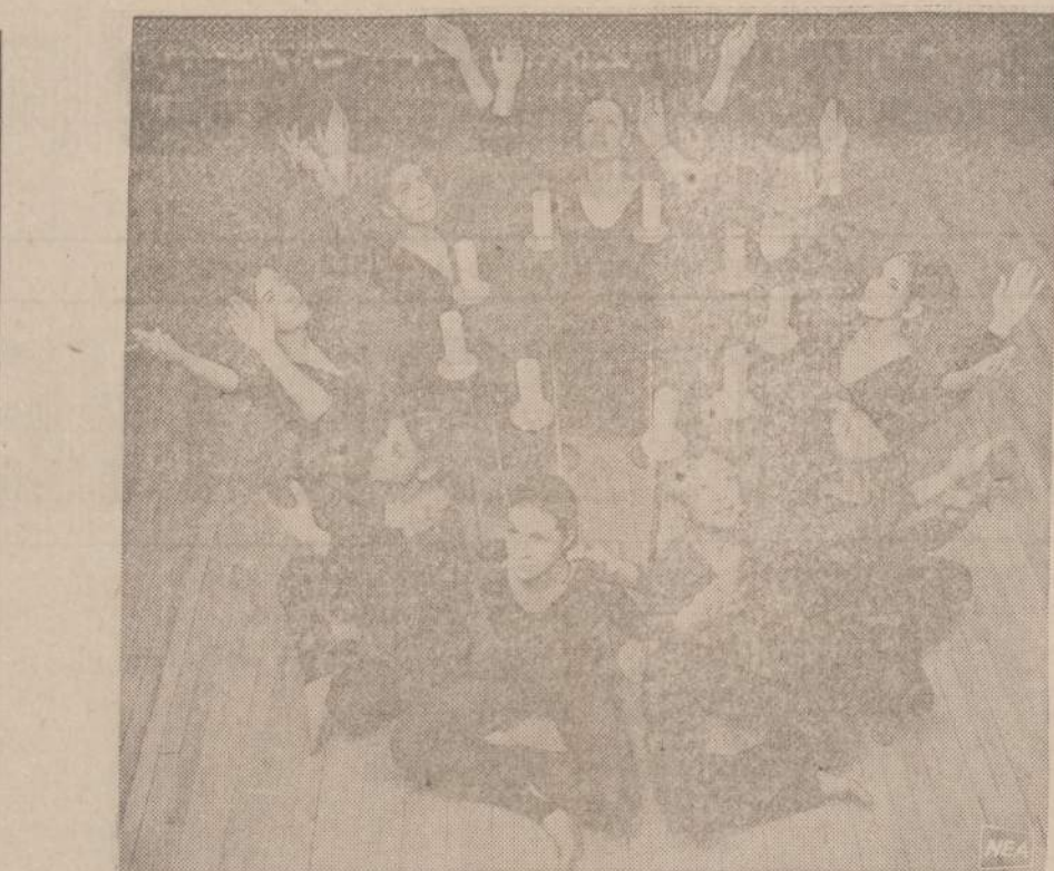
Gruodžio 5 d. prasideda žydų Hanukah šventė. Paveiksle matomos šokėjos yra sudariusios tradicinės žydų žvakidės — menoros rata. Neseniai archeologai Jeruzalėje surado po žeme seniausią, virš 2,000 metų turinčią, ant sienos iškalitą menorą.