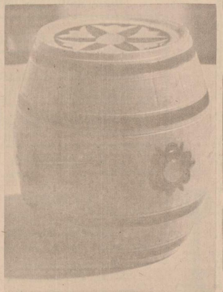
Lietuvių Gydytojų dovana astronautams.