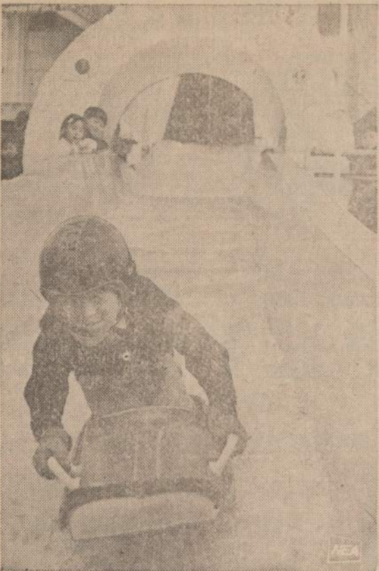
Vienoje didelėje Tokijo krautuveje yra vaikams įrengtas dirbtinio sniego kalnas. Kasdien tą 400 pėdų ilgumo roglių žluožimo šlaitą reikia papildyti šešiomis tonomis ledo.