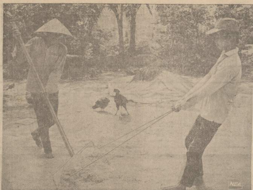
Vietname ryžių derlius supilamas tiesiog ant žemės, kur jis vėtomas vėjo tuoj dieną. Paveiksle vietnamiečiams padeda dvi vištos, kurios šitokiomis progomis gerai prisileisa ryžių.

Ekrybėlėtas vyras, kiek nustebęs pažiūrį į Paramos kalendoriumi besigėrintį bendrą. Anam baigus, jis nubistebi apie kalimą nesusipratimą. Jis pats priklausąs Prisiškėlimo parapijos "ankeliui ir jokio kalendoriaus nesąs gavęs. Dėl to jis stebisi esamu skirtumu tarp dviejų To-