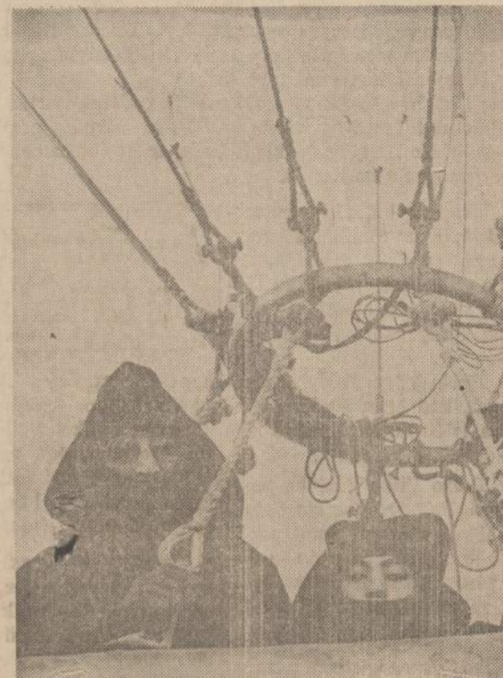
Beatle grupės narys John Lennon su žmona Yoko Ono yra fotografuoti įvairiose pozose, net lovoje. Šį kartą jie nusifotografavo didelio baliono gondoloje, pasiruošę skristi aukštyne.

LIETUVIŲ KVIENO ŽMOGAUS KRAUGAS IR BICIULIS