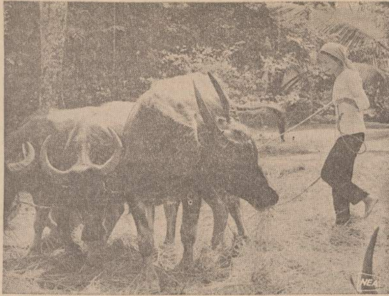
Vandens buivolai Vietname naudojami ryžių grūdamams lukštentti. Aplink varinėjami buivolai iškulia grūdus, ta pačia proga prieciūdami ryžių šiaudus.