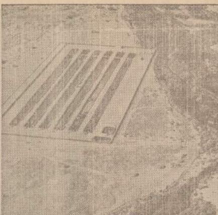
Už dešimt metų Amerikoje labai trūkti geriamo vandens, todėl daromi bandymai filtruoti naudotą vandenį. Prie Phoenix, Arizonoje pastatyti filtravimo įrenginiai, kurie kanalizacijos vandenį gryna smėlio ir augalų pagalba. Dešinėje chemikas apžiūri stiklo talpyklę su išvalytu vandeniu pavyzdį.

Washingtono administracija „pasigalėjo savo žmogeliu“, todėl Morgenthau priverstas buvo iš užimamo posto pasitraukti.