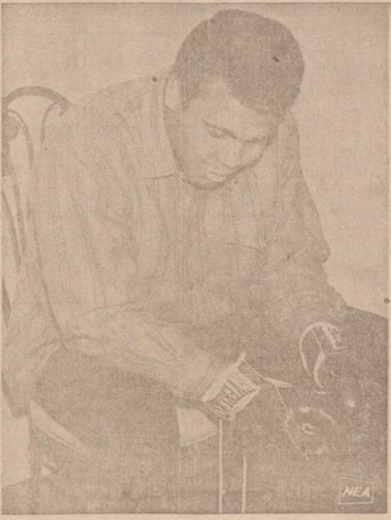
Buvęs pasaulio bokso čempionas Cassius Clay nelinksmas. Jis pabandė tapti aktorium, tačiau jo vaidinimas Broadway teatre neturėjo pasisekimo ir greit uždarė. Jis bandė suorganizuoti bokso rungtynes su Joe Frasier Floridoje, tačiau visa eilė miestų jo pasiūlymus atmetė, nes jis atsisakė tarnauti JAV kariuomenėje.

knuga „Lietuvos Vyčio pėdas-kais“. Knygą galima gauti Naujiene. Kainuoja tiktai du doleriu. — Cikagos Medziotojų - Meškieriojų Kankių Balius įvyks 1970 m. sausio 10 d. 8 val. vak. Marquette salėje, 6908 So. Western Ave. Įėjimas $1.50. Rezervacijoms tel. 776-8688. Geriausios kaukėms skiriamos vertingos dovanos. (Pr).