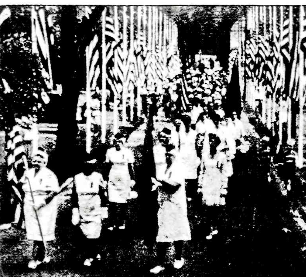
Šių metų gegužio 31 dieną Lietuvių Tautinėse kapinėse buvo gražiai pagerbti Amerikos kariai, žuvusieji už šio krašto laisvę ir palaidoti tautinėse kapinėse. Kapinėse dalyvavo gausus Amerikos Legiono dalinys, susidedas iš Dariaus Girėno ir Don Varnas Postų. Paveiksle matome Amerikos Legiono nares, žingsniuojančias Vėlavų Alėja, šį pavasarį Amerikos Legiono įrengta Lietuvių Tautinėse kapinėse.