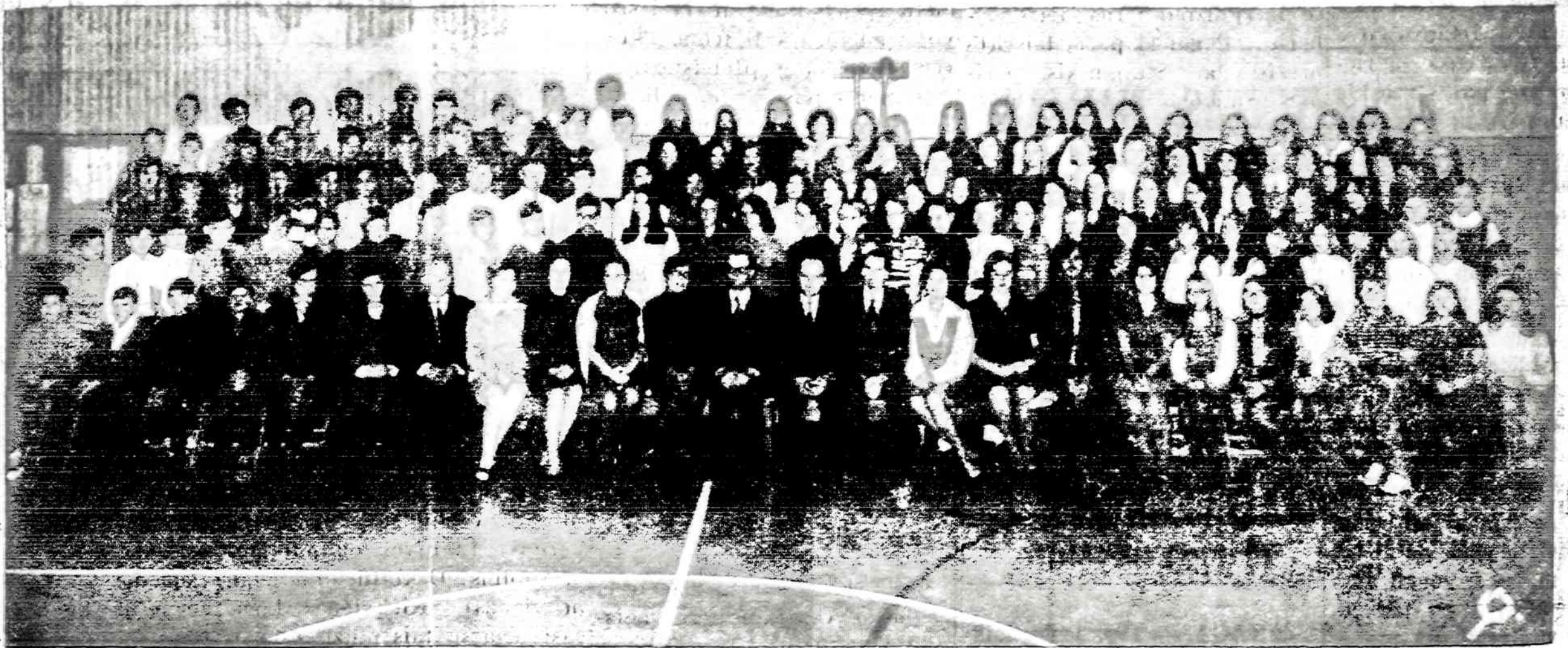
Kristijono Donelaičio Aukštesnioji lituanistinė mokykla su mokiniais ir mokytojais 1970-71 mokslo metais

"BIZNIERIAL KURIE GARSINASI "NAUJENOSE". — TURI GERIAUSIĄ PASISEKIMĄ BIZNYJE