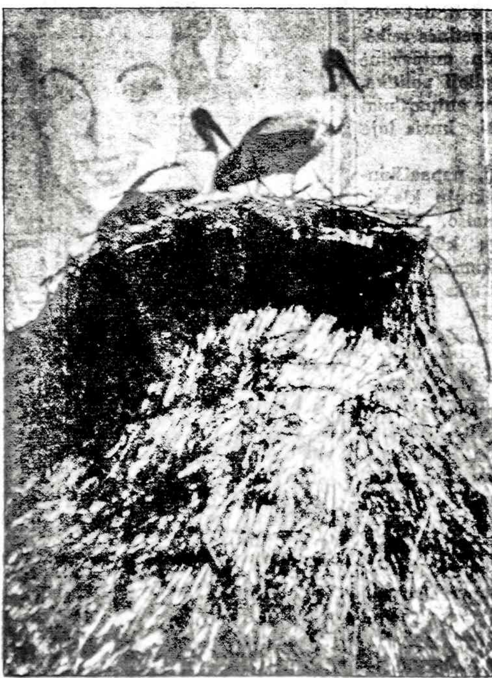
Gandralizdis ant nendrėmis dengto namo stogo Labguvos apskrities pamario kaime