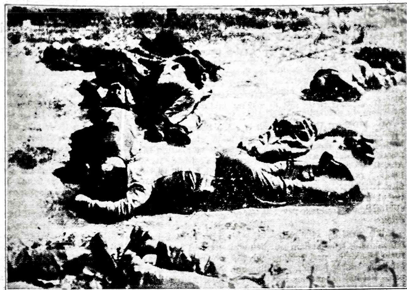
Vaidas iš 1941 m. Pra vėniškių skerdynių

Rusai senas savo knygas degina. Bet imperialistinei sovietų valdžiai labai svarbu, kad laisvi lietuviai senų knygų ir istorinių dokumentų neturėtų. Reikia žinoti, kad prieš 30 metų iš Brooklyno buvo išvežti Lietuvon didžiausi sunkvežimiai įvairios "istorinės" medžiagos. Į komunistų rankas pateko kelios didelės privačios Amerikos lietuvių bibliotekos. Vargu rasi kokį spausdintą dokumentą, kurio okupantas neturėtų. Dabartiniai rinkėjai "tarybų" Lietuvon siųs dublikatus ar triplikatus, kad jie galėtų ten juos sunaikinti. Lietuvių rankomis kultūrinis turtas jiems tikrai atiduodamas į lietuvių tautos priešų rankas.