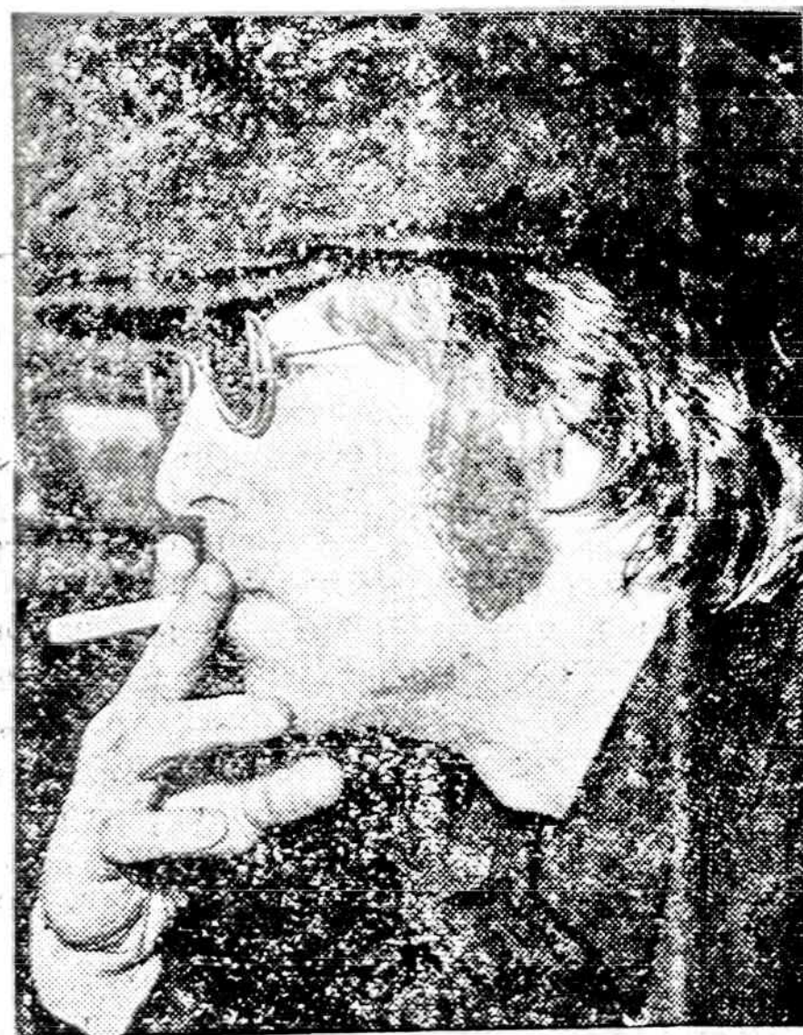
Buvęs Beatle grupės narys John Lennon laukia lėktuvo Londono aerodrome.