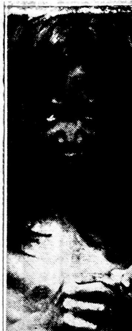
Pirmas jaunos mergaitės žvilgsnis į civilizuotą pasaulį. Ji priklauso "fasadų" genčiai, kuri neseniai surado dr. Robert Fox ekspedicija Filipinuose. Mindažo saloje gyvena gentis, kuri kalnu ir mišku atskiria nuo kitų gyventojų, naudoja akmeninius įrankius ir gyvena labai primityviu klajoklių gyvenimu.

Kartais per greitai nutautėjęs lietuvis nukentia nuo svetimtaučių ir stengiasi grįžti atgal prie lietuviško gyvenimo, nes nuėjęs pas svetimtaučius, pasidaro tik trąša svetimtaučiams, ir jokių vadovaujamos vietos negali užimti. Duosiu keletą pavyzdžių: Lietuvių radijo vedėjas ruošia lietuvių dienas ir kviečia daug svetimtaučių aukštų po-