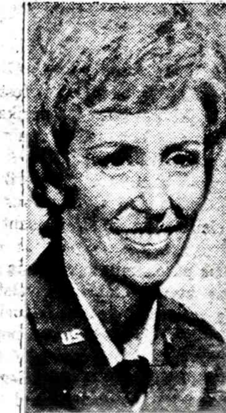
Pirma moteris — JAV karo aviacijos generolas. Jeanne Holm.

Mirusio žmona protestuoja, kad ligoninė nepašė jos leidimo panaudoti vyro plaučius ir širdį. Ji net nežinojusi, kad vyras ligoninėje mirė. Kai ji buvo vyro aplankyti, jis gerai atrodė ir ji tikėjosi, kad jis pasveiks. Tik iš laikraščių ji sužinojusi, kad vyras miręs, o jo širdis įdėta kitam.