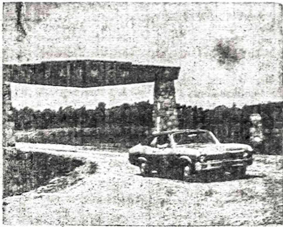
PRO ŠIUOS VARTUS SUVAŽIAVOME! JUBILIEJINĖ STOVYKLA,

kuri prasidėjo rugpjūčio 19 ir baigsis rugpjūčio 29. Tai nuolatiniai vartai Boy Scouts of America pūkių stovyklavietės Beaumont vietovėje, apie 60 mylių nuo Clevelando.