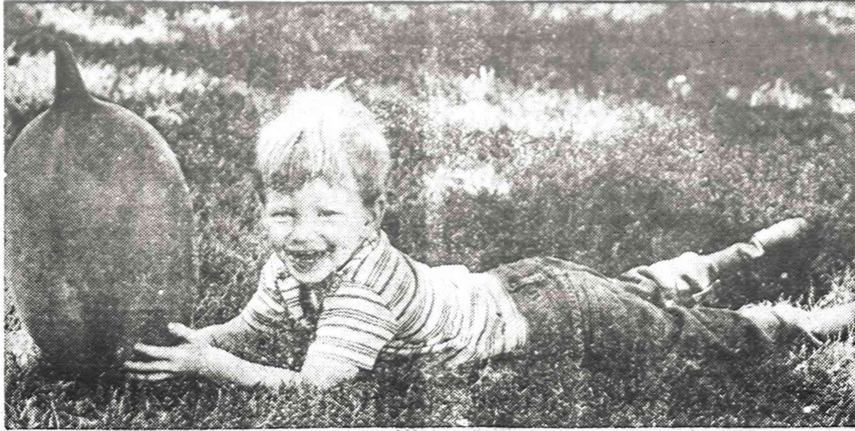
Paprastas, spalvotas balionas gali sukelti mažam vaikui didelį džiaugsmą.

Ties enciklopedijos yra penki tomai, kiekvienas pilnai išbaig-