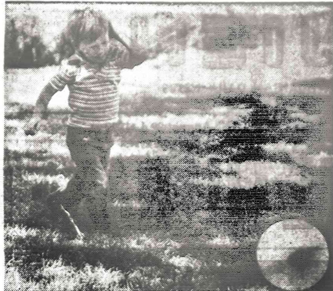
Vėjas pučia baltą tolyn, jo savininkas susirūpinęs bėga paskui.

Daugelyje pasaulio kraštų senesniųjų skaičius gausėja. Ypač taip vadinamuose išsivysčiusiuose kraštuose dabar gimę vaikai gali tikėtis sulaukti 70 savo amžiaus metų. Taip pat pailgėjo amžius ir tu, kurie jau dabar yra sulaukę 70 metų. Bri-tanijoje laukiama, kad ketvirta-