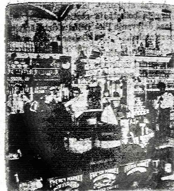
1903—a time of no credit, a 12-hour workday, and no Payroll Savings Plan.

1739 So. Halsted St., Chicago, Ill. 60608