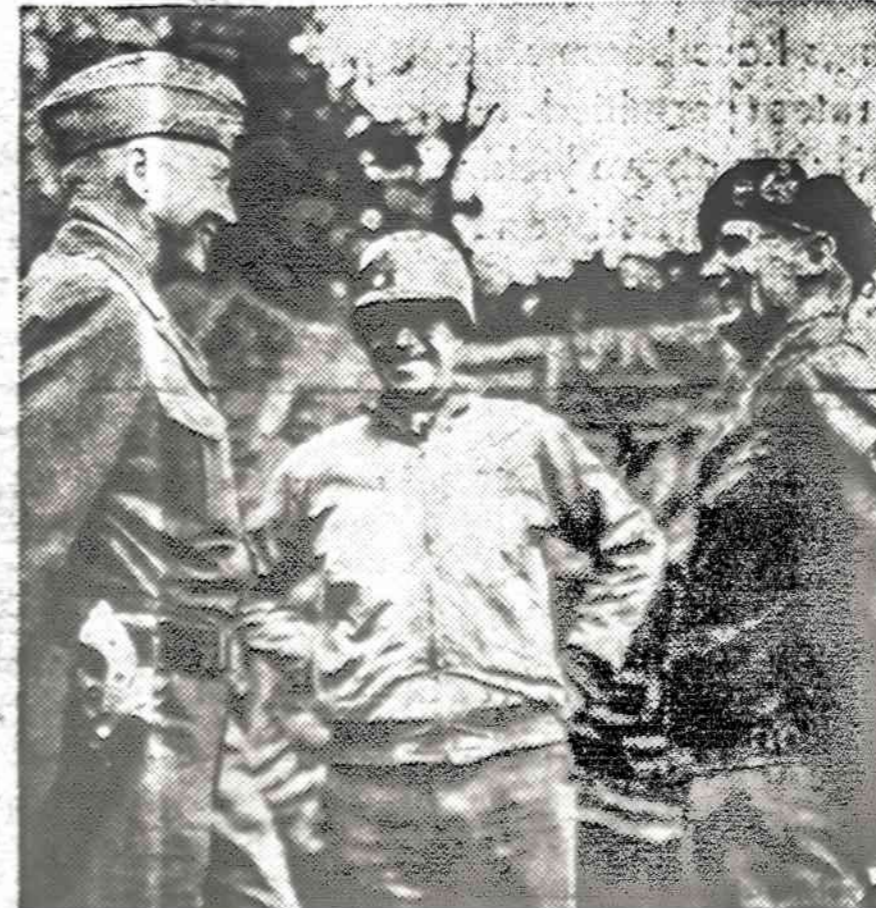
Historinė nuotrauka iš II-ojo Pasaulinio karo. Viduryje stovi generolas Bradley, kairėje gen. Patton ir britų feldmaršalas Montgomery. Generalui Bradley ne kartą teko išspręsti Pattono ir Montgomery kvičius.