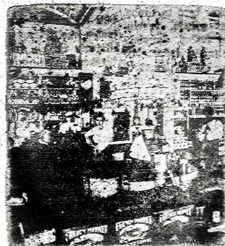
1903 — a time of no credit, a 12-hour workday, and no Payroll Savings Plan.

1739 S. Halsted St., Chicago, Ill. 60608 — Tel. HA 1-6100