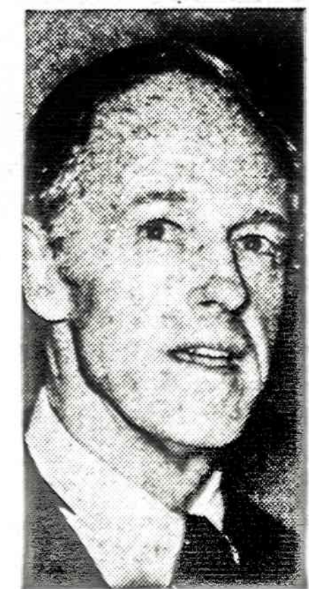
Howard Hunt, kuris nuteistas kalėti už įsilaužimus į demokratų Watergate būstinę, vėl buvo klausinėjamas senato komitete. Jis pareiškė nuomonę, kad jo grupė išdavė demokratų įstatytas respublikonų komitete šnipsas.

• Demokratų partijos komitetas, kuris turi paruošti 1976 metų konvencijos delegatų išrinkimo tvarką, susikilo ir negali susitarti dėl klausimo, kas turi važiuoti į konvenciją.