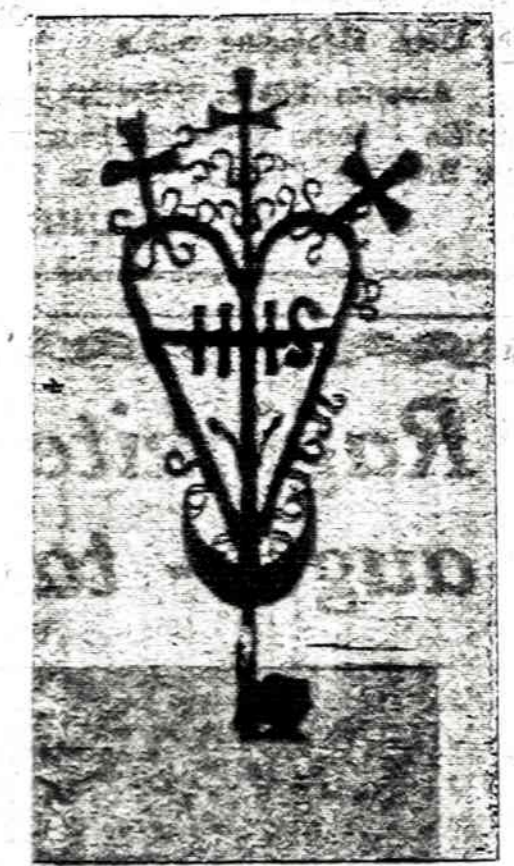
LIETUVOS MENAS

Savo metu keliaudamas po Europą, specialiai kreipiau dėmesį į lankomų kraštų — valstybių policiją ir susidariau įspūdį, kad neprikl. Lietuvos policija jokiai atžvilgiu ne kiek nebuvo prastesnė už kitų, senų valstybių policiją, o bendra kultūra, išvažda ir drausmė bei viešose vietose laikysena, daugelį kitų pralenkdavo.