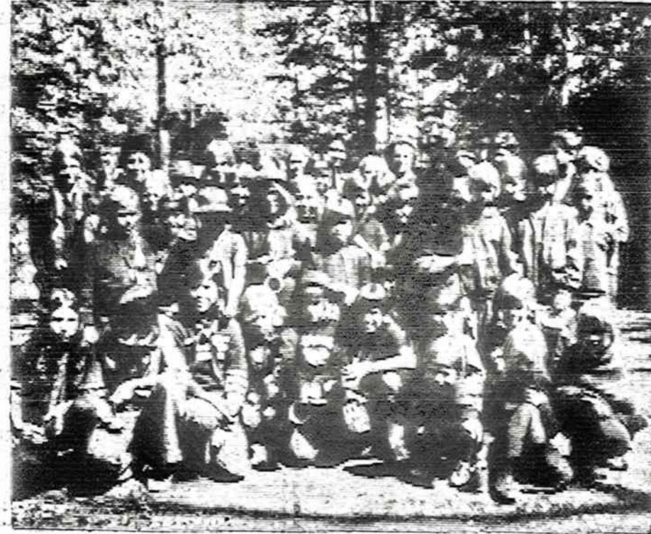
"RYTMETELIO" JAUNESNIŲ SKAUTIŲ STOVYKLA

Blezingėlės: paukštė Lietuvos laukų, o mės skraidom čia tarp ažuolų.