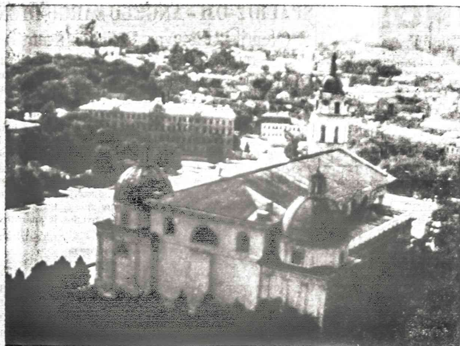
Vilniaus vaizdas nuo Gedimino kalno. Nuotrauka daryta pereiniais metais čekiškio turistu

Šiuo atveju daroma didelė klaida, nes tabako nikotinas lengvai prasiskverbia ir per odą, ypač lengvai į kūną nikotinas patenka per sužeistą odą. Jis greitai nuodina organizmą. (B. d.)