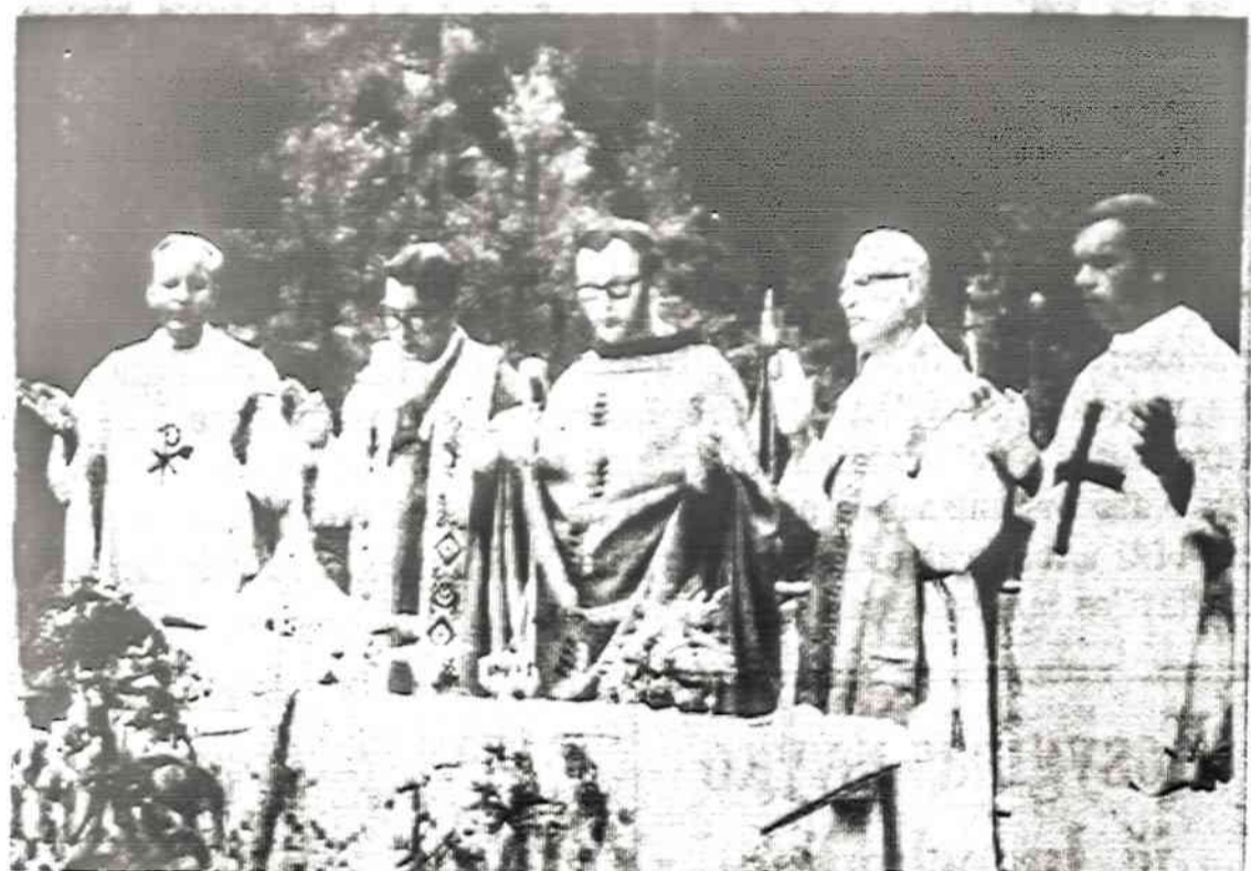
SKAUTININKAI KUNIGAI LAIKO ŠV. MIŠIAS JUBILIEJINĖJE STOVYKLOJE