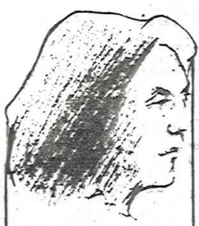
JANE ADDAMS (1860-1935) Humanitarian. Opened Hull House Settlement in Chicago, helping to bring about laws estab- lishing better social order- child labor bills, eight-hour work day, unemployment, insurance and votes for women. Awarded Nobel Peace Prize in 1931.