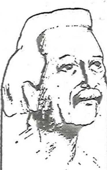
ALBERT EINSTEIN (1879-1955) Mathematician-Physicist. Between 1905 and 1916 became world famous for his Theory of Relativity, merging the traditional concepts of space and time. His thoughts were instrumental in the dawn- ing of the Atomic Age.