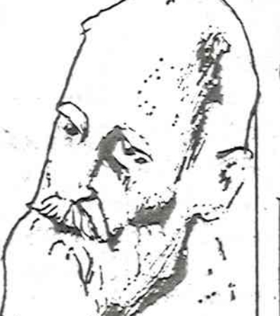
GEORGE BERNARD SHAW (1856-1950) Playwright and social critic, noted for his sarcastic wit. Began his career as a music critic, but noted more for his amusing and stimulating plays about his contemporary scene.