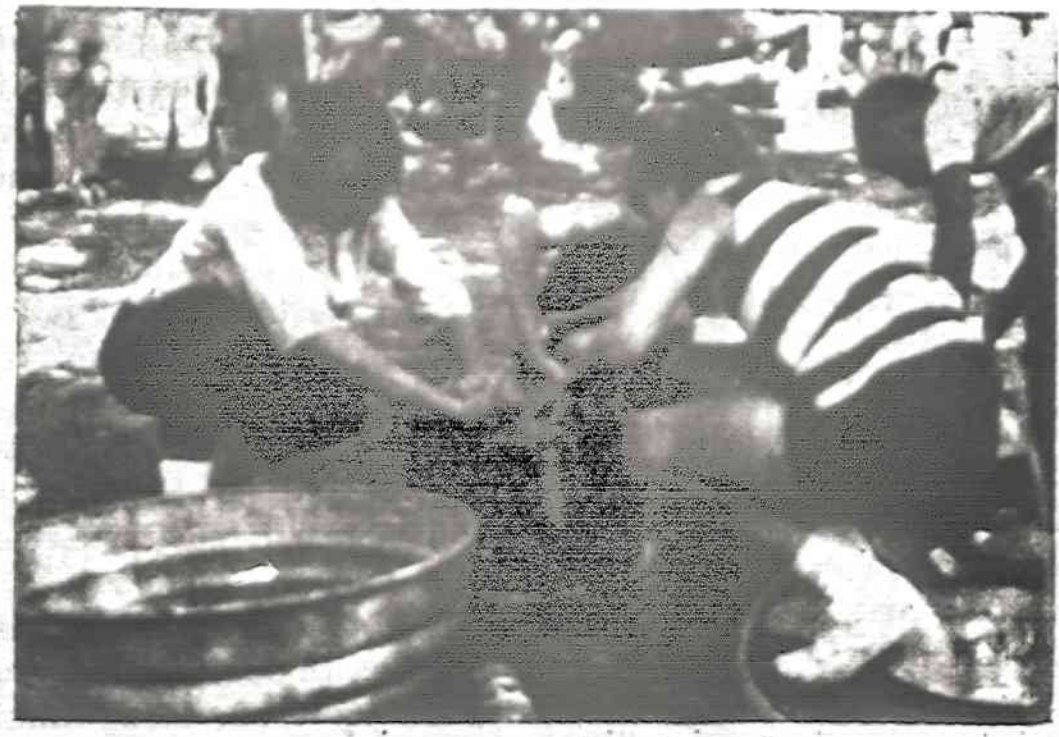
Kai nebuvo dar Alvedo... prausėmės iš blūdo...

Rūkančių moterų vaikai dažnai gimsta mažesnio svorio, negu normalūs vaikai. Mažesnio svorio gimęs vaikas yra nepakankamai atsparus. Jis vystosi ir auga lėčiau. Rūkančioms moterims retkarčiais nikotino intoksikacija išsukia priešlaikiną gimdymą arba pradžioje neštumo išsukia abortą. Prieš laiką gimęs vaikas dažnai būna silpnas už normalų. Kai kada toliu susirgo sarcoma (vėžio ligos variantas), o po 24 savaitių 98% pelių susirgo kitais pikty-