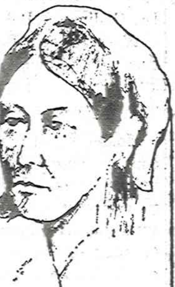
FLORENCE NIGHTINGALE (1820-1910) Hospital Re- former. Trained as a nurse at Kaiserwerth and Paris. Later in life organized a school for nurses and a nur- ses' home at St. Thomas' Hospital in London, setting standards used today for care of the sick.

We have a chance to add to this list of outstanding men and women.