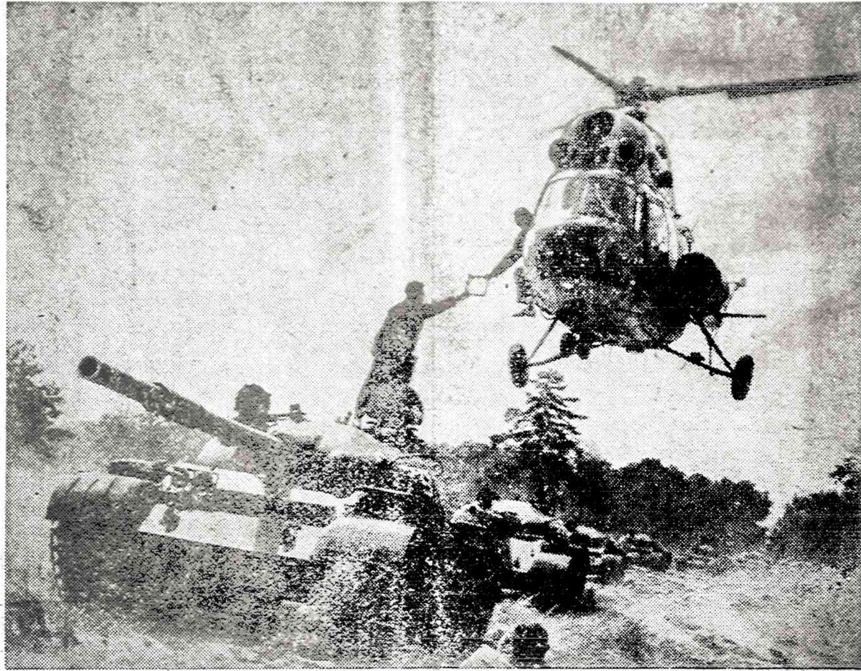
Sovietų agentūros Tass paskelbta propagandinė fotografija rodo susižinojimo metodą karo manevruose. Helikopteriai nusileidžia prie tankų vilkstines ir perduoda tankistui iš žabo siunčiamą įsakymą. Tas tankas, tur būr, neturi radijo ryšio.

Gandhi vyriausybės kritikai sako, kad susirišdama su Maskva, premjerė Gandhi pavertė Indiją "susirišusia" valstybe, nors tradicija reikalauja, kad Indija, įsteigus "Trečiąjį Pasaulį" liktų nesurišusi nei su Maskva nei su Washingtonu.