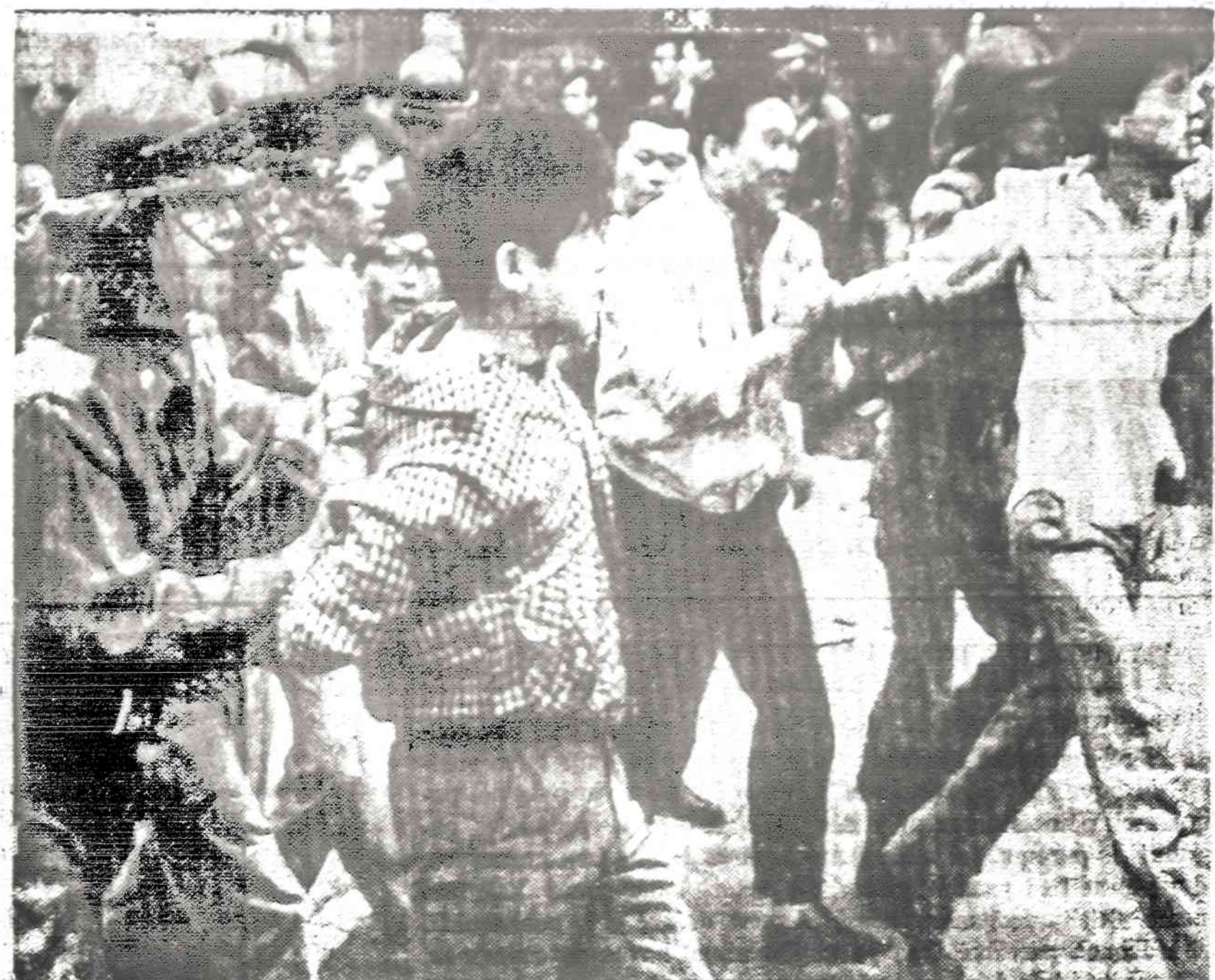
Pietų Korėjoje nerimauja studentai. Čia matome policiją, išvedančią iš universiteto riausių vadus.

SKAITYK PATS IR PARAGINK KITOS SKAITYTI NAUJIENAS