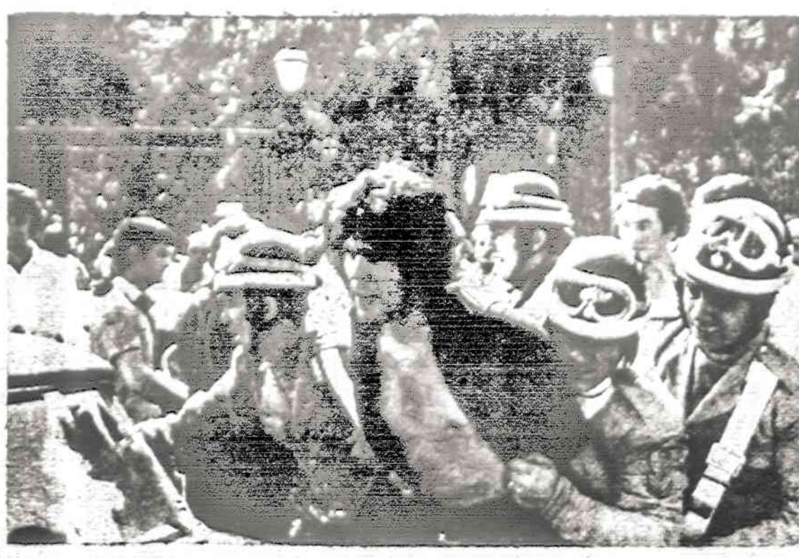
Neapolieji policija sulma riaušių dalyvius. Po choleros epidemijos tame mieste būna daug neramumų, dėl kurių atstatytinio miesto meras ir visa taryba.