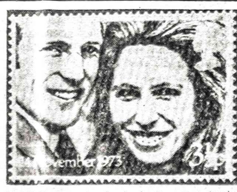
Nors Britanijos princesės ir kapitono Mark Phillips sutuoktuvės įvyks tik lapkričio 14 d., Britanijos pašto valdyba jau išleido du pašto ženklus su jaunųjų vėdais. Vienas ženklas yra 3½ pensų vertės, kitas — 20 pensų.

Australijoje elektros jėgainių streikas, aerodromo techniku, pašto tarnautojų ir geležinkeliečių streikai sudarė žmonėms daug nemalonių. Alaus brangių streikas atnešė alaus stoka, elektros srovės sumažėjimas pakenkė fabrikams ir daug kas laikinai neteko darbo. Dėl to piliečiai kaltina darbiečių vyriausybę, kurios veiksmais nepatenkinti ir streikuojantieji darbininkai.