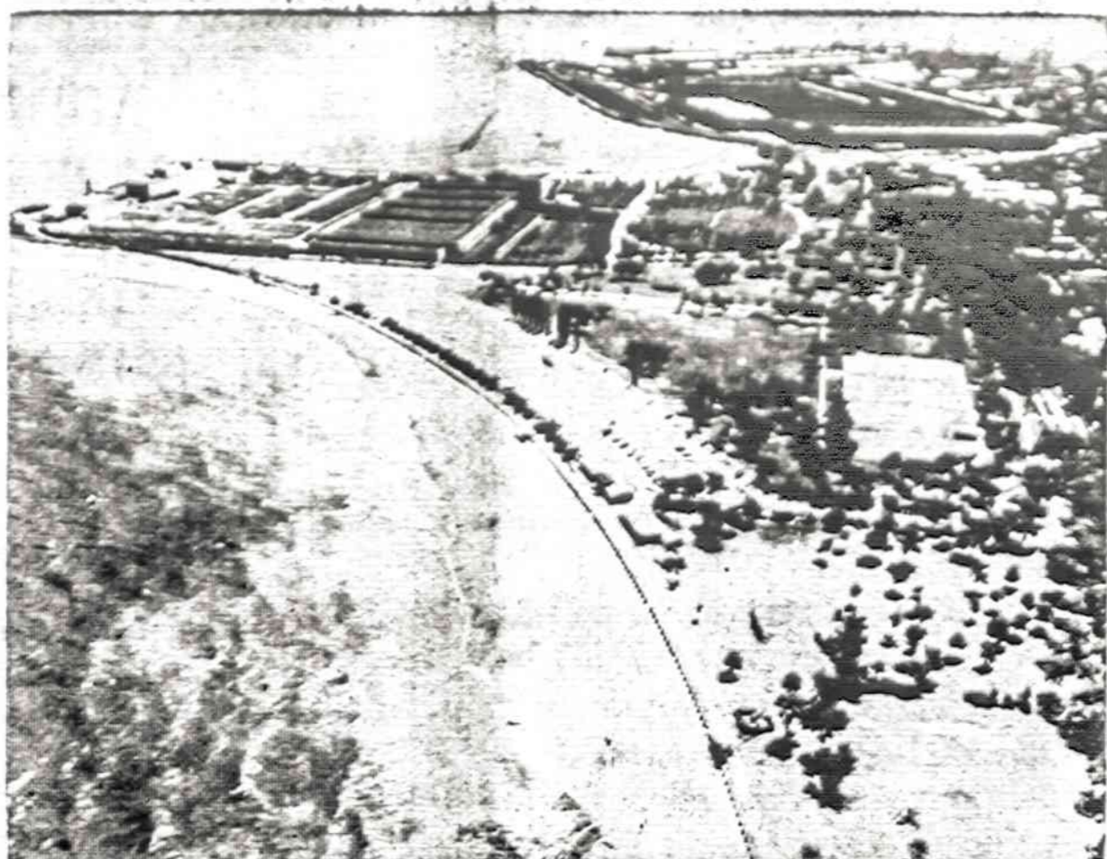
Čikagos Rainbow Parkas prie 79 gatvės ir ežero, anksčiau būdavo mėgiama lietuvių susitikimo vieta. Ši 62 akrų parką kasmet bando okupuoti vienos rasės žmonės, bet baltieji vis dar atsilieka.

Antroji paroda buvo pas amerikiečius Phoenix'e, Arizonoje, Seserų vienuolyne. Parodą la-