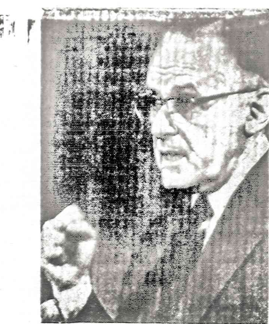
Zemės ūkio sekretorius Earl Butz daug važinėja po Ameriką ir susitikinėja su ūkininkais. Jis nutaręs pagerinti ūkininkų gyvenimą, nors vartotojų kainos ir brangs.