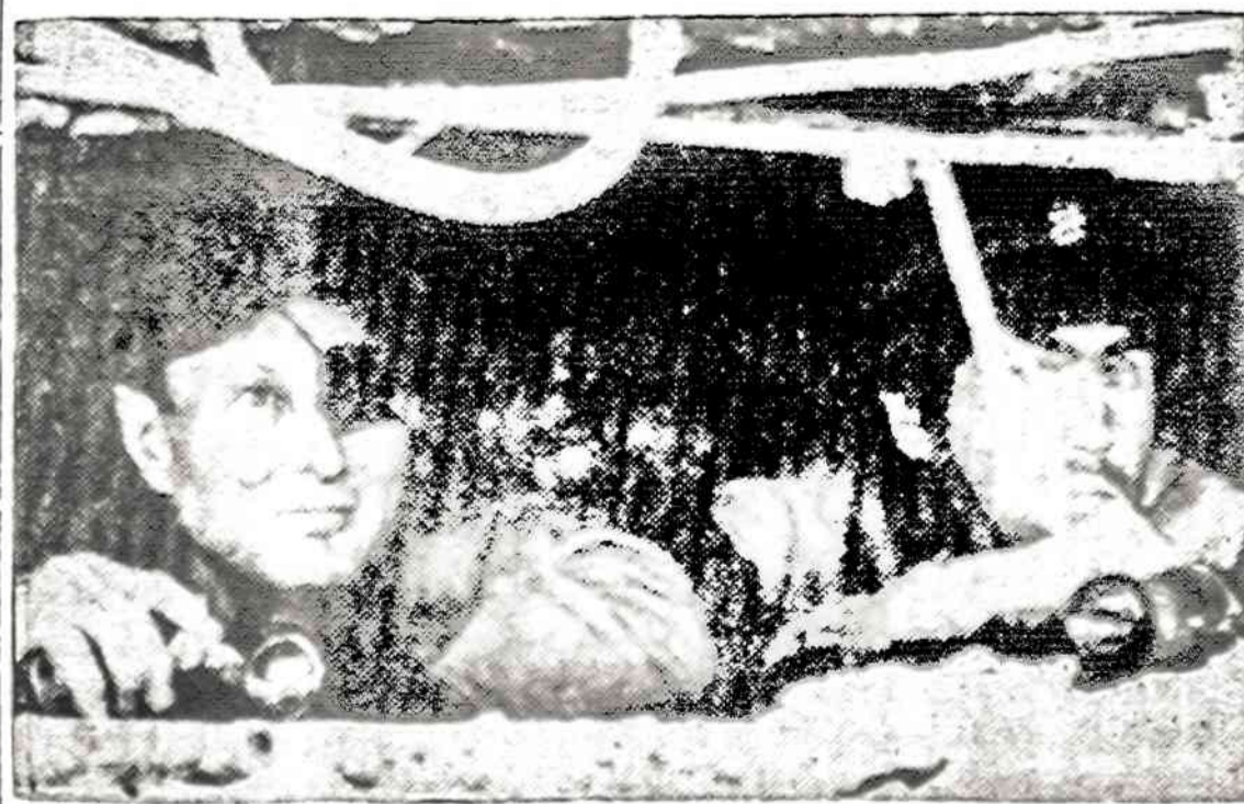
Izraelio gynybos ministeris Dayanas (kairėje) su adjutantu sėka iš požeminio bunkerio tankų kovas Sirijos pasienyje.

• Izraelis pareiškė protestą Prancūzijai, kad jos parduoti Libijai lėktuvai naudojami Egiptui kare prieš Izraelį.