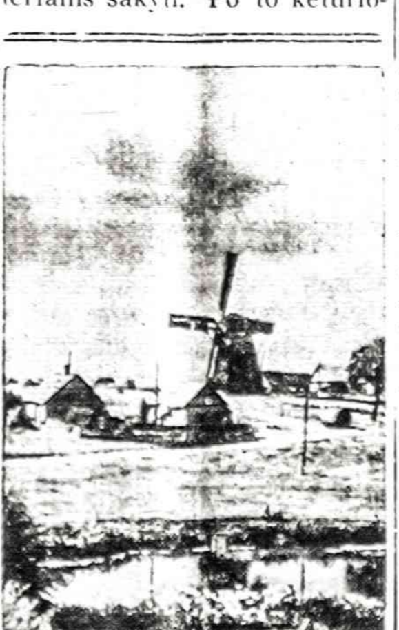
Vejo malūnas Panevžio apylinkėse, kur dabar malami iš Amerikos atvežti kviečiai.

Jiedu tą mergytę nusivedę į vienuolikmetės gyvenamąjį namą, esantį ketelį namų atstumu Sheitos tėvų namo. Nusivedę į namą aukšte esantį kambarį, kur ją išaukė per 2 valandas, ką jie per tą laiką darė, policija atsisakė reportieriams sakyti. Po to keturi-