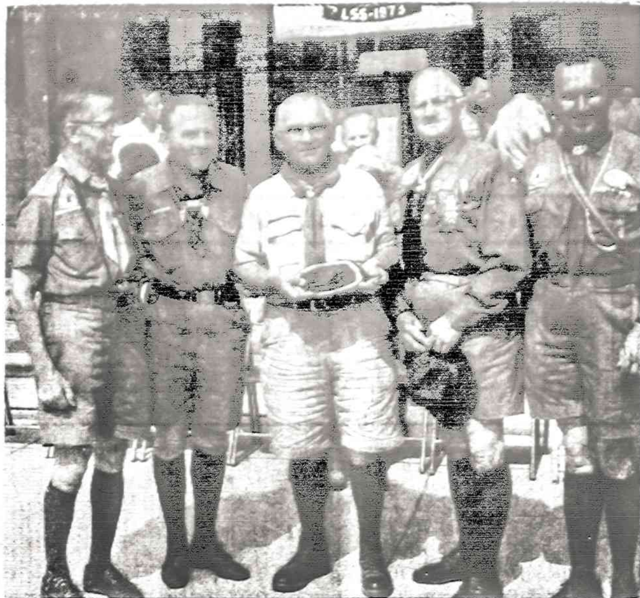
Iš v. s. V. ŠENBERGO PAGERBTUVIŲ

Toliau — malda, vakarienė, dainos ir šokiai. Ši 200 vietų užpildyta salė turbūt dar niekad taip neskambėjo nuo studentiško jaunimo dainų, kaip šį vakarą. Kažin, ar šiandien kitai organizacijai pavyksta sutraukti pusantro šimto narių iš studijuojančių, kaip šį vakarą turėjo ASS šventė. ASS spalvomis puošėsi ir daugelis tuntų vadovų, rodydami gražų pavyzdį jaunesniems LSS sesėms ir broliams. B. B.