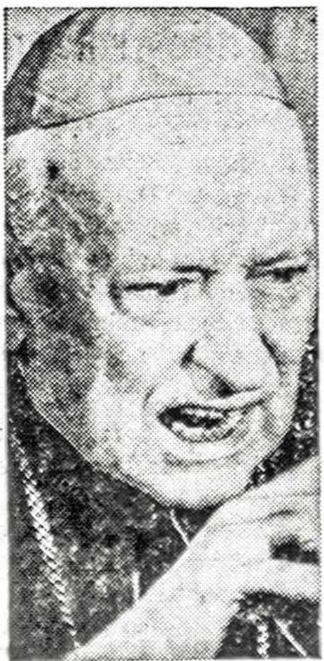
Vengrijos katalikų primas, egziliuotais 16 metų, kardinolas Jozsef Mindszenty neseniai lankėsi Amerikoje.

MADRIDAS. — Ispanijoje lankosi Japonijos sosto įpėdinis princas Akihito ir princesė Michiko.