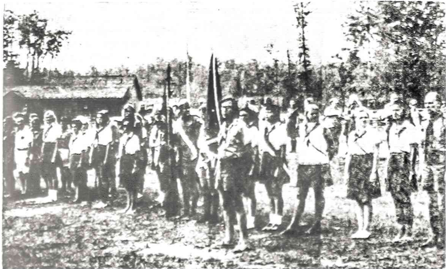
AKADEMIKAI SKAUTAI JU ILIEJINEJE STOVYKLOJE, bclaukdami ben rojo parado.

NAUJIENOS 1739 So. Halsted Street Chicago, Ill. 60608