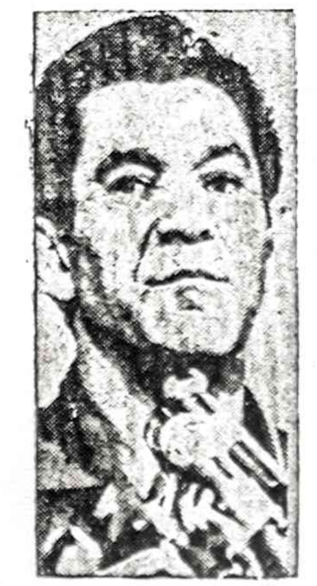
Izraelio kariuomenės štabo viršininkas gen. David Elazar atsakinėja į korespondentų klausimus. Jis pareiškė, kad Izraelis laimės karą, tačiau kovos bus kietos ir nuostolingos.