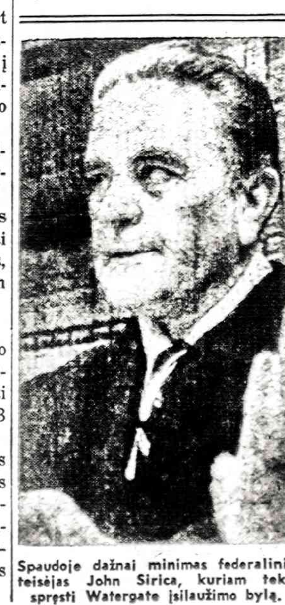
Spaudoje dažnai minimas federalinis teisėjas John Sirica, kuriam teko spręsti Watergate įsilaužimo bylą.

Dalis graikų karininkų išbėgo iš Graikijos, kai šamokslas buvo išaiškintas ir dabar Britanijoje mokosi prekybos laivyno akademijoje. Jiems atimta graikų pilietybė.