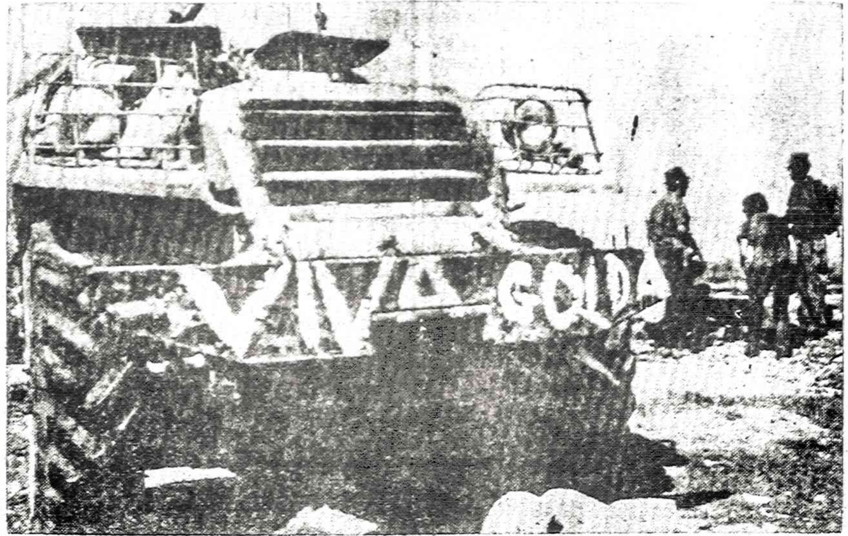
Izraelio karinis automobilis važinėja po Egiptą su užrašu priekyje — "Viva Golda". Kareiviai išreiškė savo pagarbos sentimentus premjeri Goldai Meir.

DUBLINAS. — Airijos vyriausybė įsakė prarasti tarydumus, kaip iš kalėjimo helikopteriu galėjo būti išvežti trys teroristinės armijos vadai. Valdžia žada sustiprinti kalėjimuose apsaugą.