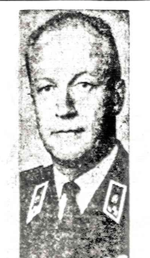
Suomijos gen. Ensis Siilasvuo, Jungtinių Tautų įgaliotinis Egipte, turi gerai sugyventi ir su arabais ir su žydais.

WASHINGTONAS. — Senatas priėmė užsienio paramos įstatymą, kuris skiria 504 mil. dol. Indonijai paramai. Karinei paramai skirta visa pasaulyje 962 mil. dol.