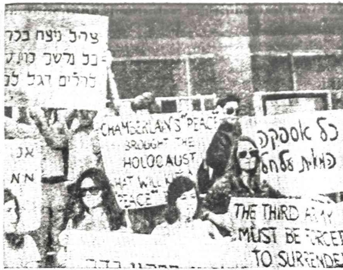
Izraelyje dešiniųjų grupių žmonės protestuoja prieš vyriausybės nuolaidas arabams.

Idomu, kad krašto valdyba sausio taisyklėse aiškino 30 skyriuje, kad "Norėdamas balsuoti laišku, balsuotojas ne vėliau kaip iki gegužės 10 kreipiasi į artimiausią apylinkės rinkimų komisiją, kad atsiųstų balsavimo kortelę. Kovo mėn. tas paragrafas išimtas, nors, kaip vėliau