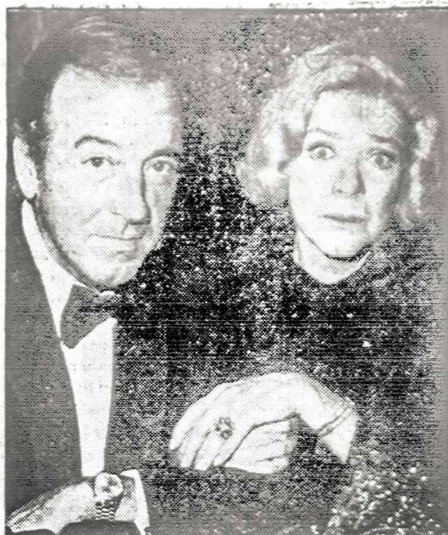
Seniai matyti Hollywoodo veidai: John Payne ir Alice Faye. Jie abu grįžta į Broadwayje atgavinamą muzikinę komediją "Good News".

Skundams paduoti terminas prasideda ne nuo paskutinės balsavimo dienos, kaip komisija klaidingai aiškina, bet nuo paskutinės rinkimų dienos, t. y. nuo komisijos darbo pabaigimo dienos. Rinkimai baigiasi tada, kada paskelbiami rinkimų rezultatai.