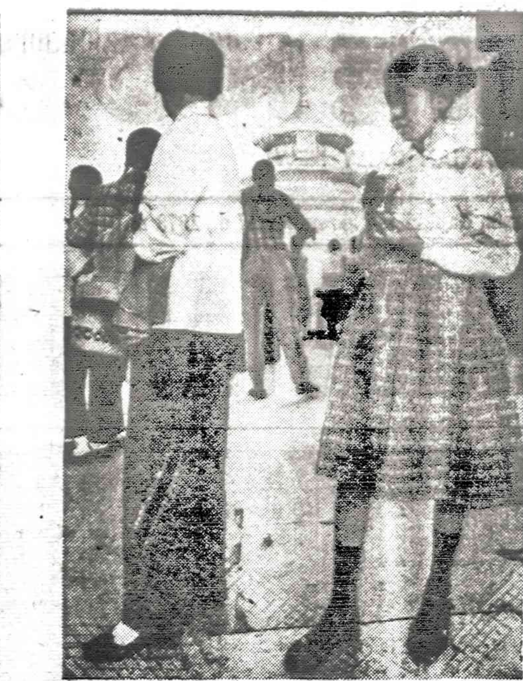
Kinijoje turistai elgiasi, kaip visur kitur. Čia matomi jaunuoliai, atvykę į Pekiną iš provincijos.