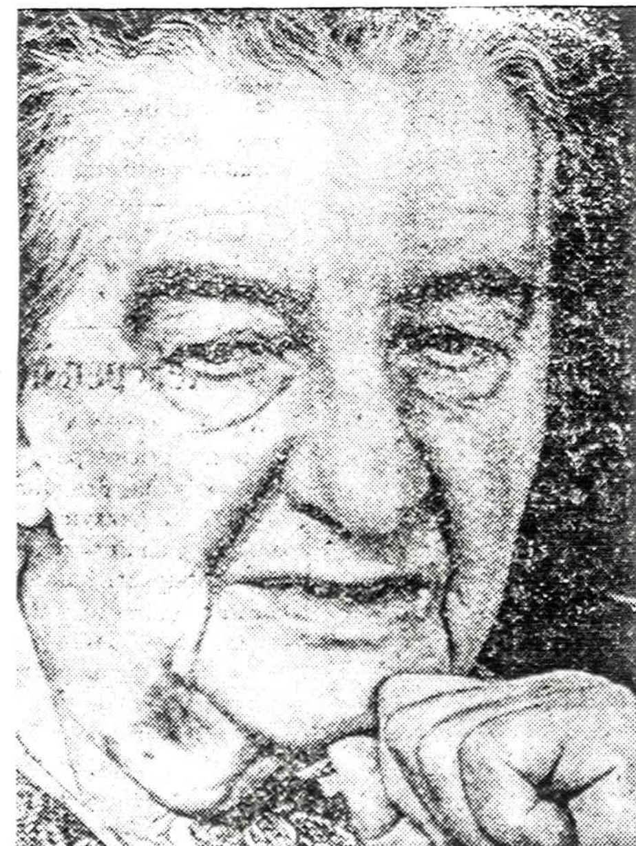
Izraelio premjere Golda Meir turi daug rūpesčių. Ateina rinkimai, o jos vyriausybė opozicija smarkiai kritikuoja.

Japonijos spaudoje jau yra pasiūlymų nutraukti su Izraeliu diplomatinis ryšius. Japonija pasiryžusi kapituliuoti prieš arabų spaudimą, tačiau tas pažeistą tradicinę Japonijos neutralią politiką ir galėtų sukelti priešišką reakciją Amerikoje.