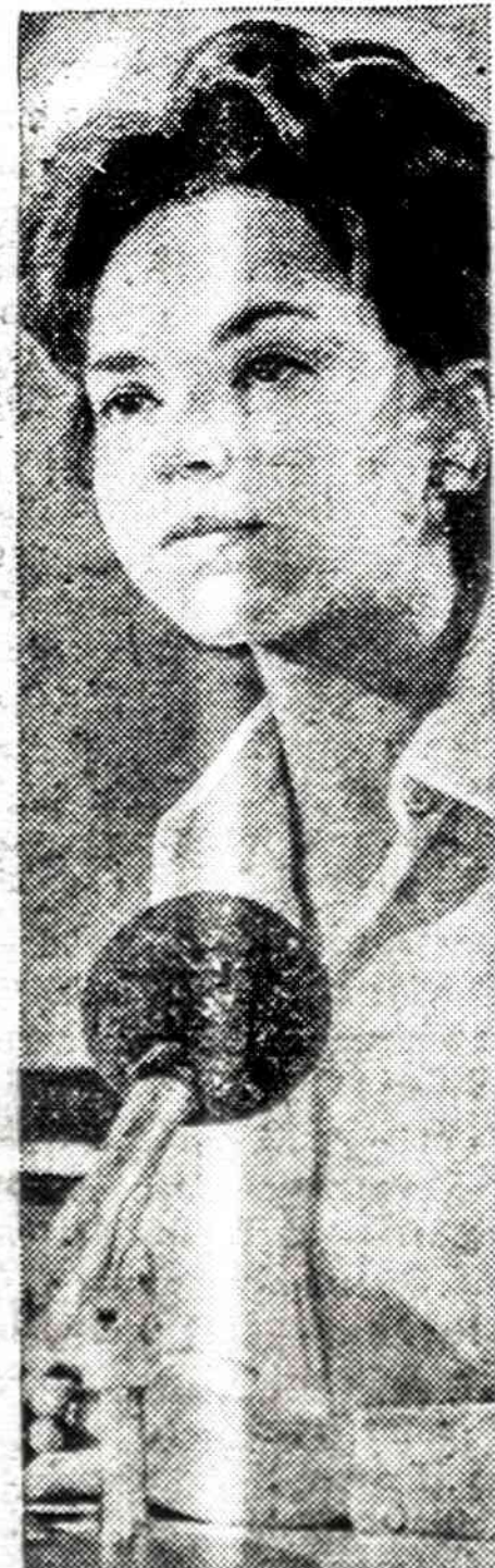
Julie Nixon Eisenhower pasirodė esanti šalta ir iškalbinga savo tėvo gynynei, nebijanti ir kiečiausių reporterių klausimų.