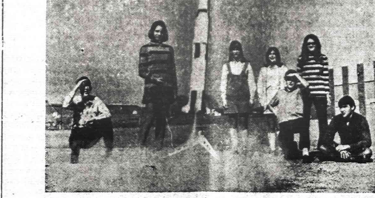
Amerikoje yra daug jaunimo klubų, kurie stato įvairias raketas ir ruošia jų varžbas.

Tačiau, kai reikėjo apibūdinti istorinę dabartį, kurioje vyksta lietuvių tautos kova už savo egzistenciją ir laisvę, tai viskas buvo paskandinta bendrybių frazeologijoje. Nepasakyta, kad artėja didysis lūžis pasaulinėje politikoje, kuris tiek Lietuvai tiek visus laisvinimo veiksmus