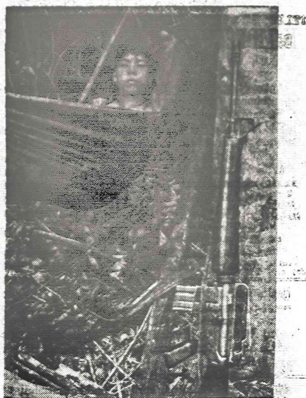
Pietų Vietnamo kareivis išsisi netoli Kambodžijos sienos, kur komunistai užėmė Kien Duc miestą.

Esu buvęs tose tautinėse kapinėse. Apžiūrėjęs jas, radau man simpatiškas, manęs, kaip tikinčio ir praktikuojančio kataliko neatstumiančias. Radau, ten ir daug paminklų su kry-