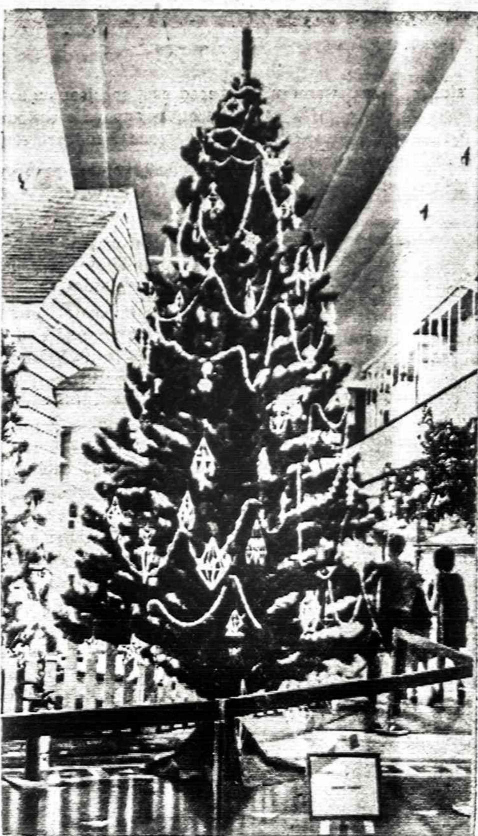
Lietuviška Kalėdų eglutė Gamtos Mokslių muziejui.

FBI žiniomis praeitais metais per visas JAV-bes buvo nužudy-