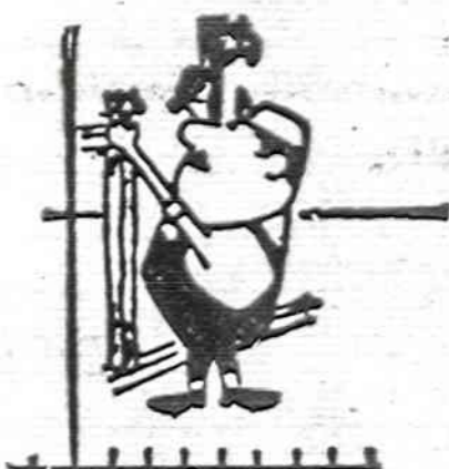
"NAUJIENOS" KIEKVIENO LIETUVIO DRAUGAS IR BIČIULIS

Svajambu maldykloje pasijaučiau, kaip kokioje katedroje, o kai įlipau į bokštą, tai mačiau Katmandu, kaip iš Eifelio bokšto.