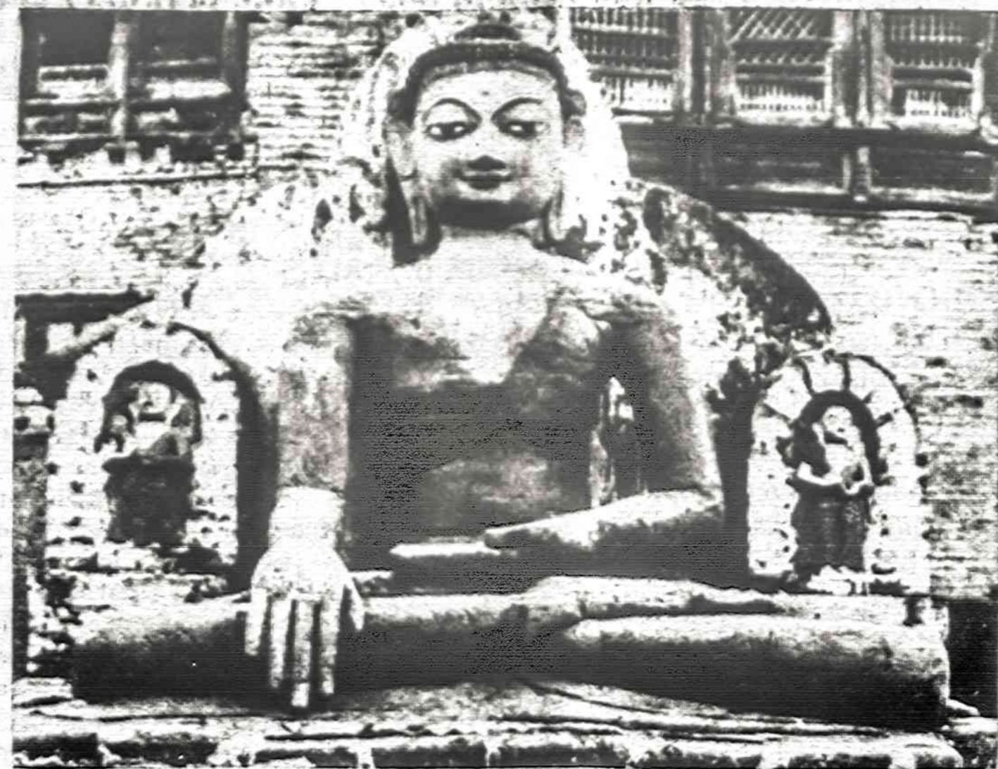
Pats išmintingiausias Svajambu Buda. Sienos išrašinėtos gilomis jo išminties mintimis. Nepalio tikintieji žmonės kartoją Budos pasakytas mintis ir bando jas taikyti kasdieniniame gyvenime.

Iš Kalkutos skrendant į Katmandu, Sagarmatos kalnas ir jį pereinantis kelios aukštų kalnų viršūnės matėsi dešinėje. Sagmata, kaip jau minėjau yra Everestas. Jis matosi, jei vanduo žemyn. Pavasarį nuo kalnų bėga tirpstantis sniegas, o vasaros metu bėga išlytas vanduo.