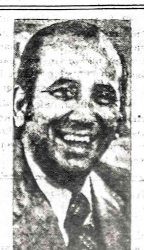
Naujas Venecuolos prezidentas Carlos Andres Perez lengvai laimėjo rinkimus. Jis pareigas perims kovo mėn.

Italijoje politiniai teroristai paleido Fiat bendrovės direktorių, išlaikė jį visą savaitę ir negavę reikalaujamo išpirkimo mokescio.