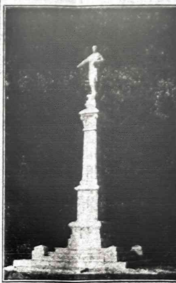
Simano Daukanto paminklas Papilėje