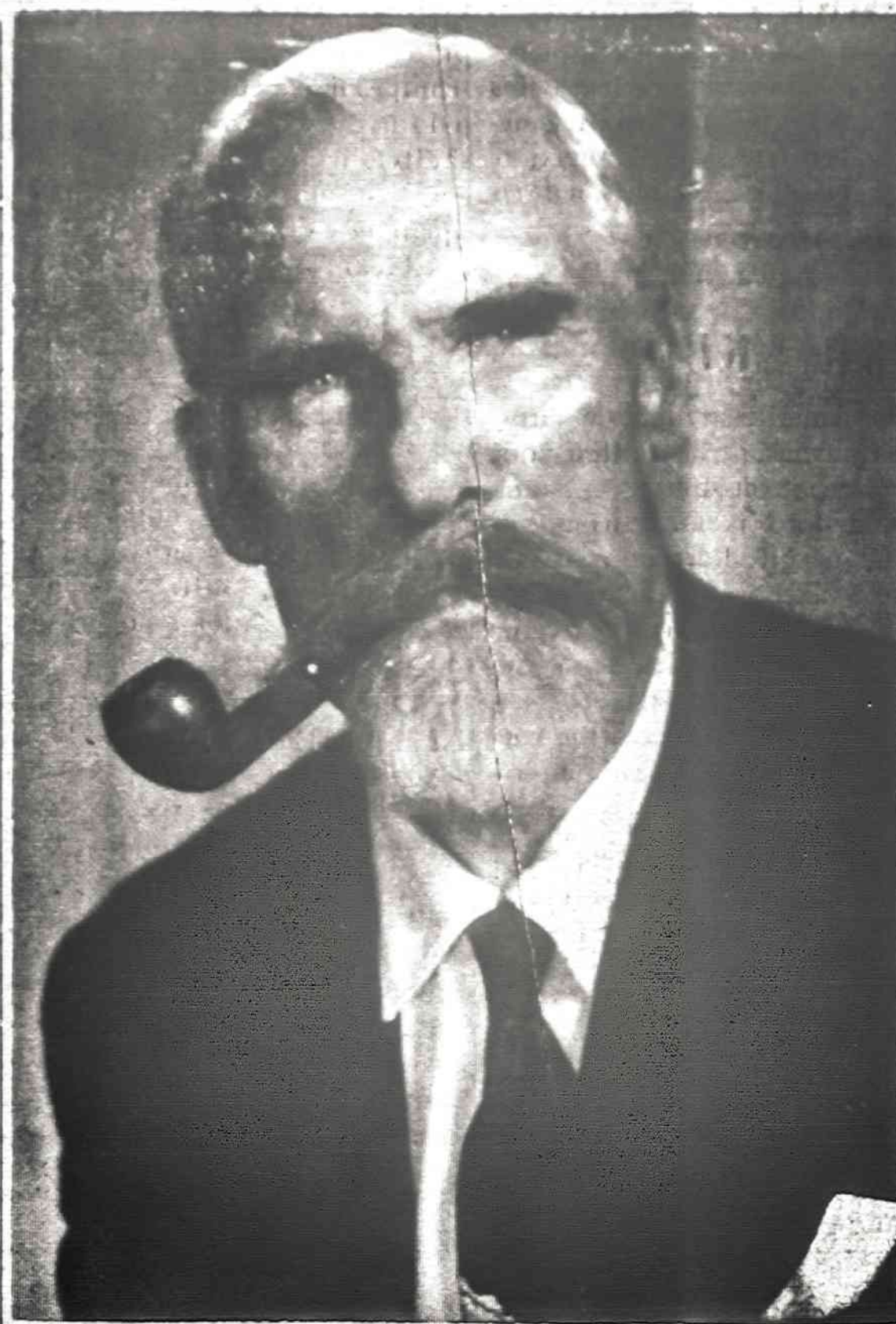
Generolas POVILAS PLECHAVIČIUS

Gen. P. Plechavičius buvo apdovanotas sekančiais ordinais ir medaliais: Vyties Kryžiaus 1-os rūšies 3 laipsnio ordinu, Didž. Liet. Kun. Gedimino 2-ro laipsnio ordinu, Jo Didybės Italijos karaliaus "Corona d'Italia" ordinu ir Lietuvos savanorių — kūrėjų medaliu, Lietuvos Nepriklausomybės 10 metų sukaktuvių medaliu ir Latvių "Aissardzibas Bieribas Bronzas medaliu".