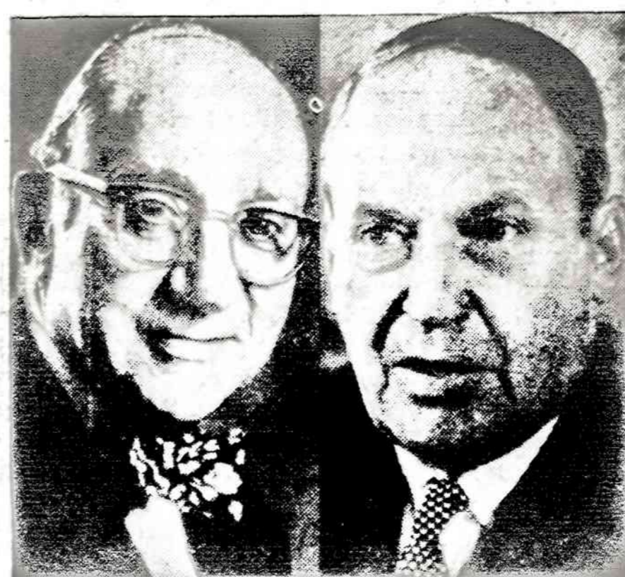
Valstybės prokuroro vieton numatytas Čikagos universiteto profesorius Edward Levi (kairė). Buvęs valstybės prokuroras William Saxbe paskirtas JAV ambasadoriumi Indijoje (dešinėje).