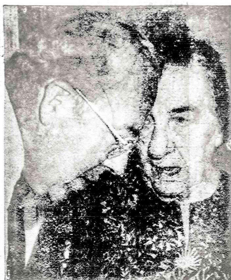
"Žmoniškumo premijos" laimėtojai George Schultz, buvęs JAV išdo sekretorius ir Golda Meir, buvusi Izraelio premjere.

SAIGONAS. — Pietų Vietnamo Phuoc Binh miesto gatvėse vyksta aršios kovos tarp miesto gyventojų ir įsibrovusių šiaurės Vietnamo karių. Saigono kariuomenė pranešė sunaikinusi 6 priešo tankus.