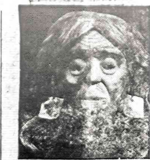
Ši medinė kaukė gaminta Britų Kolumbijos indėnų apie 1880 metus. Kaukė laikoma Denverio Meno muziejuje.

Važiavimo greičio sumažinimas ir (gazelinių pabrangus) mažiau automobilių vieškelioje buvo priežastis, kad praėjusiais 1974 metais Illinoisuje fatališkų trafiko nelaimių buvo 16 nuosimėčių mažiau kaip 1973 metais.