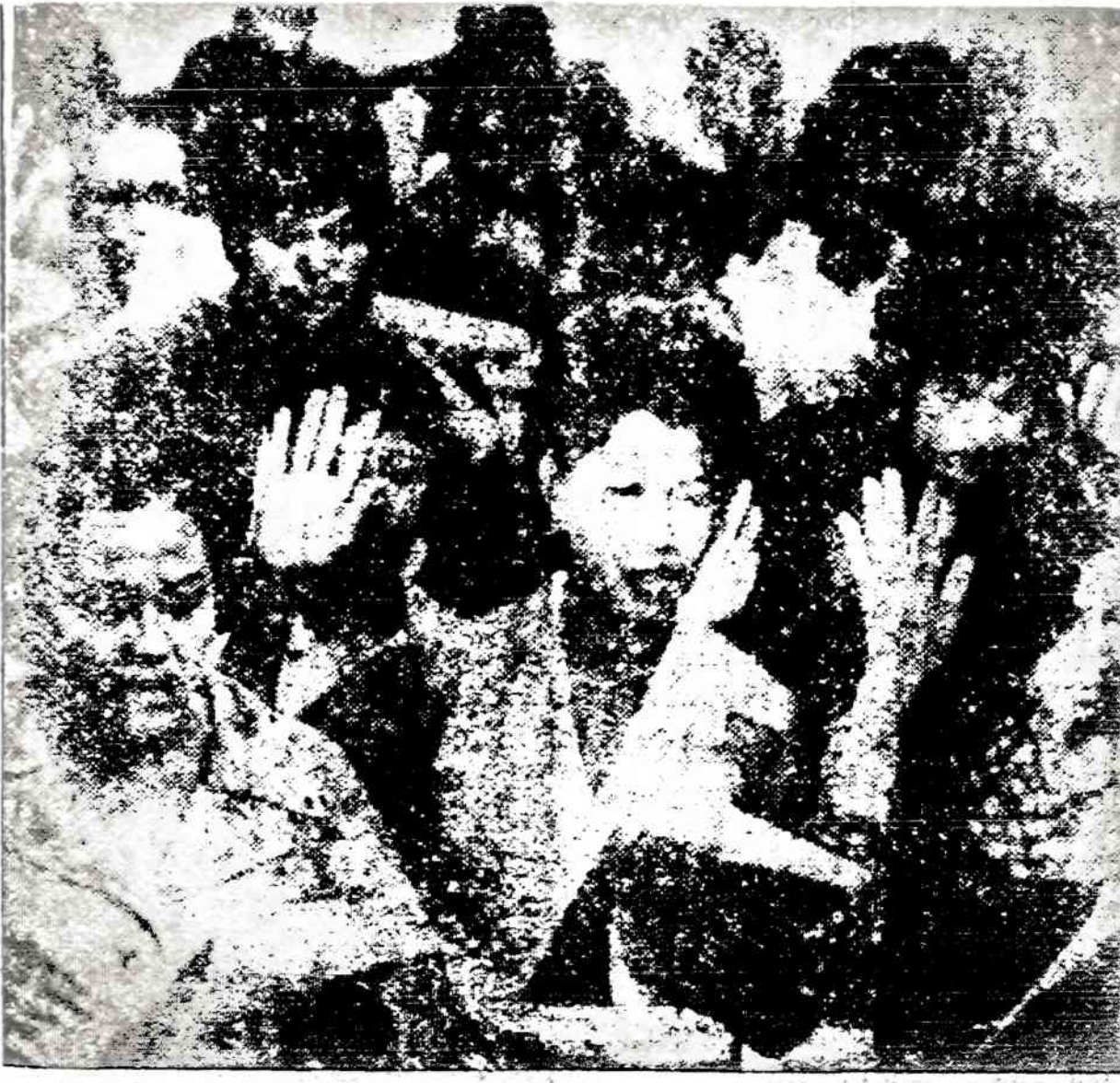
Grupė filipiniečių, paleista iš koncentracijos stovyklos, duoda priesaiką gerbti Filipinų konstituciją ir klausyti valdžios įstatymų.

JOHANNESBURGAS. — Pietų Afrikos kaimynė — Botswana valstybė, buvęs britų protektoratas, užmezgė diplomatinius santykius su komunistine Kinija.