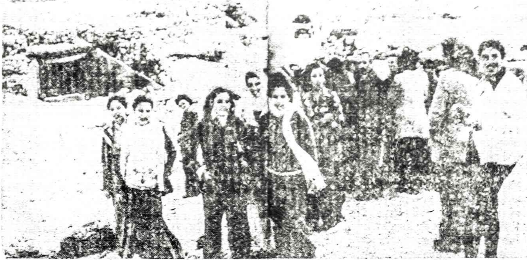
Egiptiečių mokinių ekskursijos dažnai vežamos į Sinajų, kur mokiniai apžiūri buvusius Izraelio kariuomenės pozicijas, požeminius bunkerius ir visą Bar Lev gynybos liniją, kurią egiptiečiai 1973 m. kare gan greitai pralaužė.

gumui Watergate byloje ir padėjo prokurorui išaiškinti kitus kaltinamuosius. Už tą kooperavimą Dean baismė buvo sumažinta.