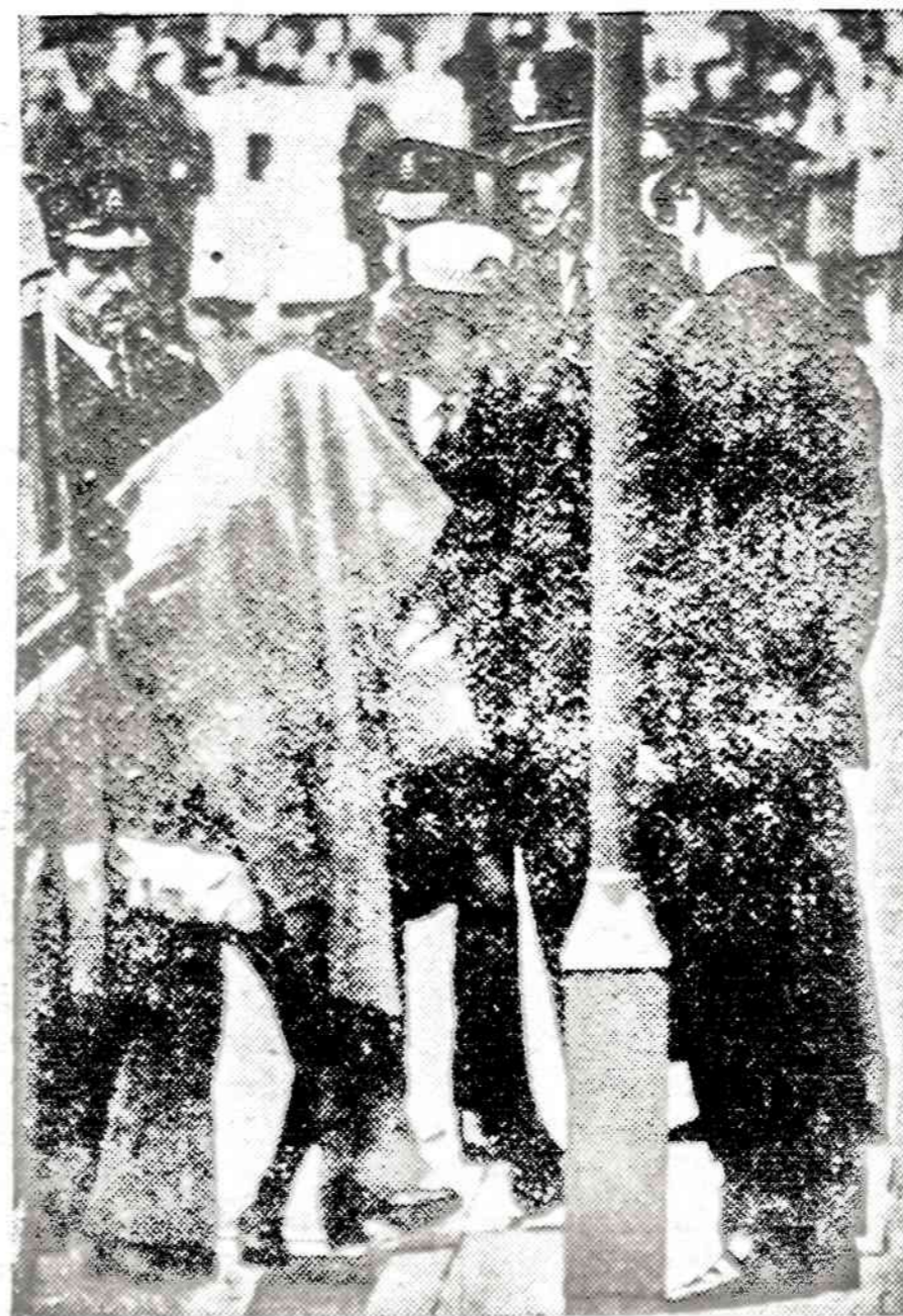
Nuo fotografų Londone slepiasi į teismą atvežta moteris, kuri kaltinama kartu su kitais penkiais airių slaptos armijos veikėjais Birminghamo tavernos susprogdinimu.

Derybose su Angolos kolonijos sukilėlių vadais Portugalijos vyriausybė susitarė dėl laikinosios vyriausybės Angoloje sudarymo. Trys Angolos sukilėlių grupės susitarė ir dėl savo karo įgėjų integravimo planų.