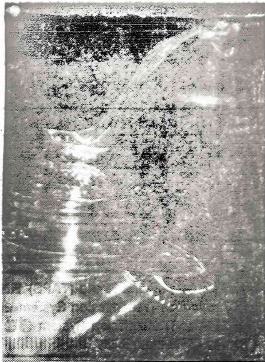
Kalifornijoje Merle Norman Tower renka gražius, istorinius daiktus, kurių ieško visi kolekatoriai. Jo muziejuje yra šis seno automobilio radiatoriaus dangtis, padarytas gyvatės formoje. Garas iš automobilio eidavo per kobros žiaunas. Šią puošmeną filmo aktorijai Mary Pickford ir Douglas Fairbanks kartą padovanojo aktorijai Rudolfui Valentino.