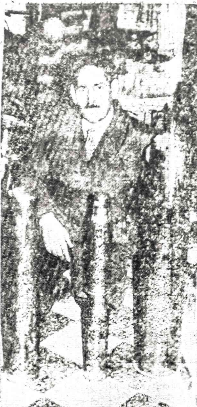
Sirijoje žydai yra skriaudžiami, tačiau šis Sirijos žydas turi Damasko papuošalų parduotuvę. Tarp įvairių prekių jis parduoda vazes, iš Izraelio artilerijos sviedinių gilzų.