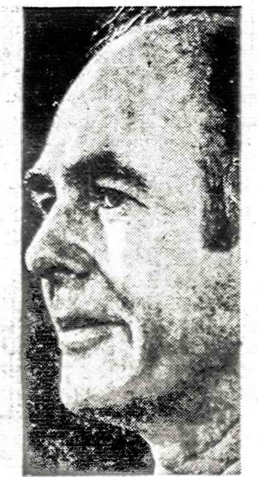
Kanados prekybos ministeris Alastair Gillespie pasmerkė amerikiečių Litton Industries bendrovės kišimąsi į Kanados reikalus. Litton skyrėsi Kanadoje norėjo parduoti Kubai už pusę milijono dol. įstaigų mašinų ir aparatų, tačiau Litton centras pasipriešino šiam bizniui.

SAO PAULO. — Brazilijoje kalnuotoje vietoje susidūrė du autobusai ir abu nukrito į bedugnę, žuvo 23 žmonės ir 55 buvo sužeisti. Policija spėja, kad užnėmė iš soferių vėjuodamas užmigo.