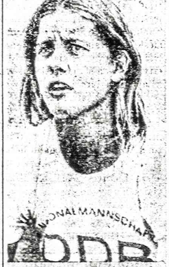
Kornelia Ender 16 m.

Sie ir kiti leidiniai yra gaunami NAUJIENOJE, 1739 So. HALSTED ST., CHICAGO, ILL. 60608 atsilankant darbo valandomis arba užsakant paštu ir pridėdant čeki ar pinigine perlaide.