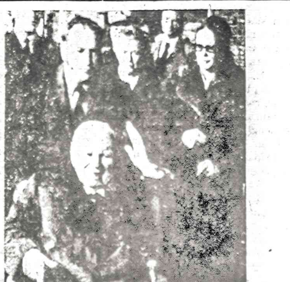
Filmų aktorius Charlie Chaplin sausio 12 d. atvyko į Londoną. Britanijos karalienė sutikė jam "Sir" titulą. Dešinėje matoma Chaplino žmona Oona.

Sistematiskas diskriminacijos ir nutautinimo akcijos, nukreiptos prieš Gudijoje gyvenančius lietuvius kaltinimai buvo išskirti Lietuvos pogrindžio išleistoje "samizdato" studijoje, kuri šiuo metu pradėjo pasiekė Vakarų. Maskva kaltinama toleruojanti ir skatinanti diskriminaciją prieš lietuvių mokyklas, kunigus, tikinčiuosius ir inteligentus Gudijos SSR ribose. (Plati Radio Liberty analizė, RL 438/74). (E)