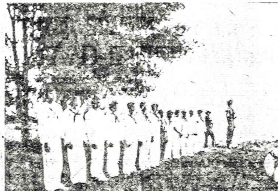
CLEVELANDO JŪRŲ SKAUTAI PRIE PYMATUNING EŽERO praėjusią vasarą įvykusioje stovykloje.