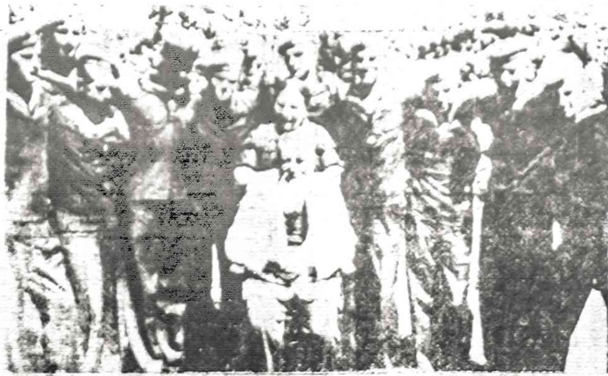
KAUNO VAIDOTO LAIVO JŪRŲ SKAUTAI,