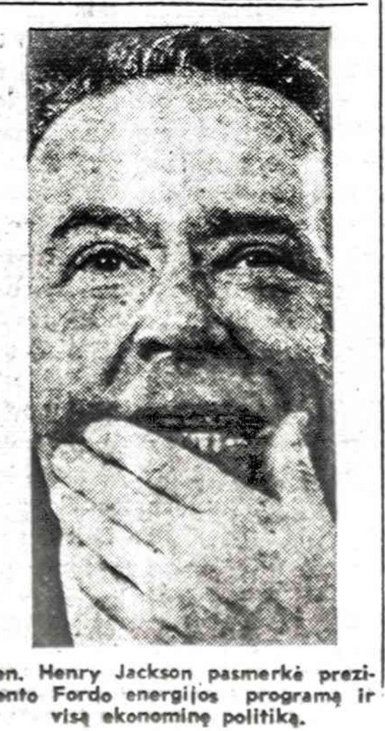
Sen. Henry Jackson pasmerkė prezidento Fordo energijos programą ir visą ekonominę politiką.