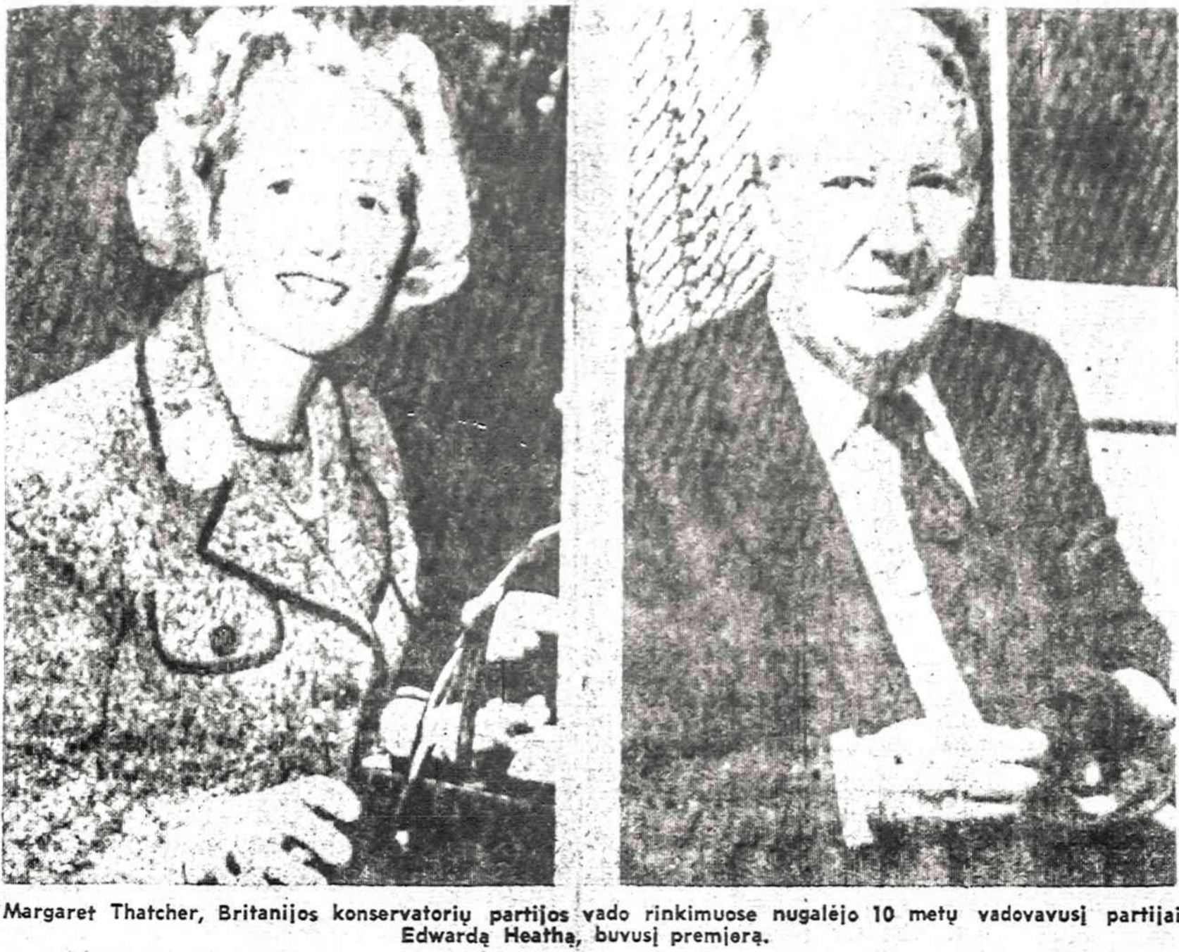
Margaret Thatcher, Britanijos konservatorių partijos vadovė nugalėjo 10 metų vadovavusį partijai Edwardą Heathą, buvusį premjerą.

pasiūlė kandidatuoti visiems 276 atstovams, o tą, kuris gaus bent du balsus paskirti vadu.