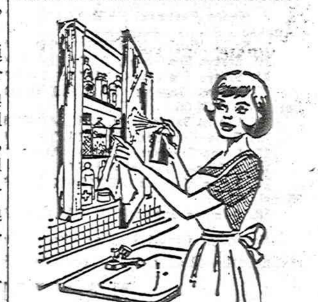
Savo namų vaistų spintelė reikia nepaprastai tvarkingai užlaikyti, kaip žinome, vaizdelyje parodyta: išimti visas dozes ir suvartoti lentynas; patikrinti visus užrašus, kad nevyktų klaidų, nes vaistų sumaišymas gali būti fatališkas.

SKAITYK IR KITAM PATARK SKAITYTI "NAUJIENAS"