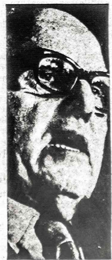
Amerikos darbo unių federacijos prezidentas George Meany pavadino prezidento Fordo ekonominius planus "keliausiais, kokius esu kada gir-dėjęs".

PARYŽIUS. — Prancūzija rengiasi Ramiojo vandenyno Muroros salose bandyti savo branduolinius ginklus po žeme. Gynybos ministerija įspėjo visus laivus, kad jie neplauktų arčiau kaip 30 mylių nuo tų salų. Įspėjimas galioja ištisiems metams.