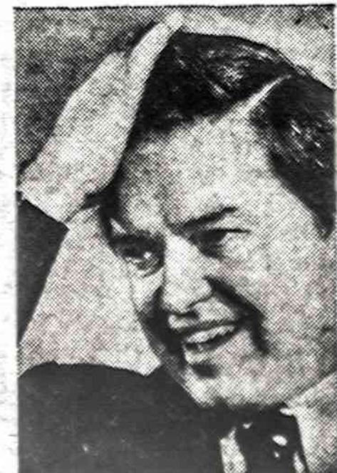
Senatorius Frank Church vadovauja senato komitetui, kuriam pavesta iširti, ar Amerikos saugumo ir žvalgybos įstaigos nesulaikė kokių įstatymų ar taisyklių.

ADDIS ABABA. — Etiopijos karinės tarnybos vicepirmininkas majoras Mengistu Heile Marian pasakė mitingui, kad Etiopija nėra žiupsnelio savo žemės neatiduos arabams. Reikalui esant Etiopija sumobilizuos 6 milijonus savanorių karių. Tuo tarpu Eritrejos sukilėliai sustiprino savo puolimus prie Asmaros miesto. Libane Eritrejos laisvinimo fronto vadas apeliavo į Amerikos vyriausybę nesijusti Etiopijai ginklų, nes jais bus žudomi beginkliai žmonės. Eritreja nori laisvės, savo respublikos, kuri niekam negrasins ir su visais sugyvens, sakoma atšaukime.