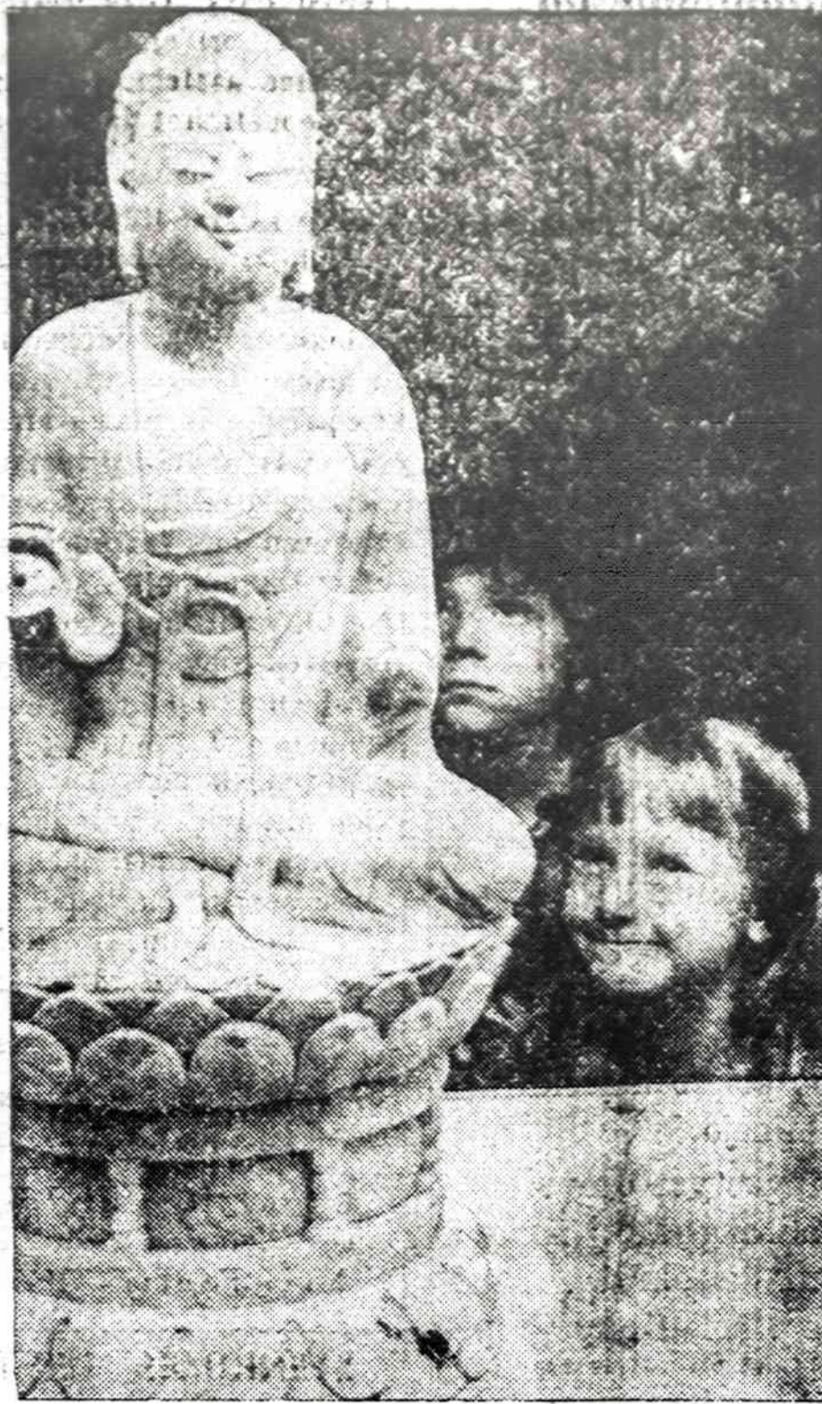
Kansas City Nelsono galerijoje rodomi iš Kinijos atvežti meno darbai. Jauna lankytoja bando pamėgdžioti 1,400 metų senumo Budos šypseną.

Po ranka turiu 1960 metų rusiškojo kolektyviniai sukurtą veikalą "Osnowy marksizma — leninizma" vokiškąjį vertimą vardu "Grundlagen des Marxismus — Leninismus". Taipgi kolektyvinį vokiečių darbą, pavadintą "Politische Oekonomie des Socialismus und ihre Anwendung in der DDR". Tai veikalai, kurie priverstinai verčiami į visų oku-