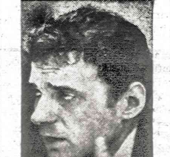
Ralph Nader, kuris gina Amerikos vartotojų reikalus, priklauso senato komitete, kad prezidento Fordo energijos programa rodomi, kad prezidentas nepasitiki konkurencijos ir laisvos rinkos sistema.

NEW YORKAS. — Gallupo apklausinėjimas parodė, kad respublikonų tarpe 49% norėtų, kad prezidentas Fordas būtų respublikonų kandidatu 1976 m. rinkimuose. Kiti 25% atsakė, kad jie Fordo nenori ir 26% neturėjo nuomonės.