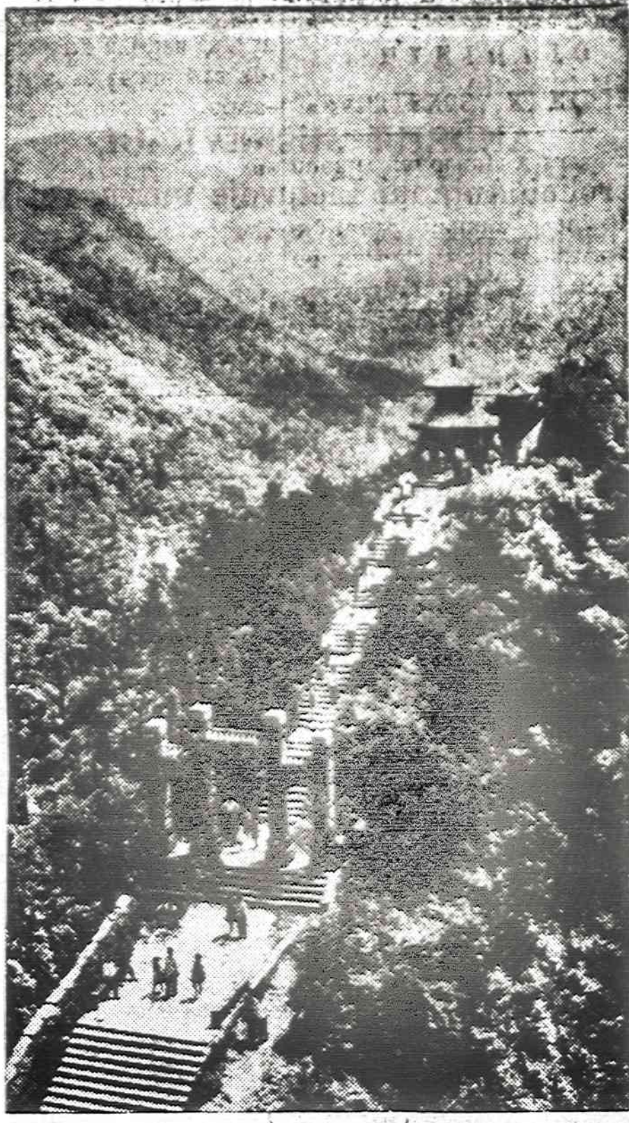
Kinijos garsus Lushan kalnas, Kiangs provincijoje, yra turistų mėgstama vieta. Sakoma, kad niekur pasaulyje nematysi gražesnio saulės tekėjimo, kaip nuo šio 5,000 pėdų kalno.

Tampos International aerodromo dienraštis St. Petersburg Times savo šeštadienio kovo 22