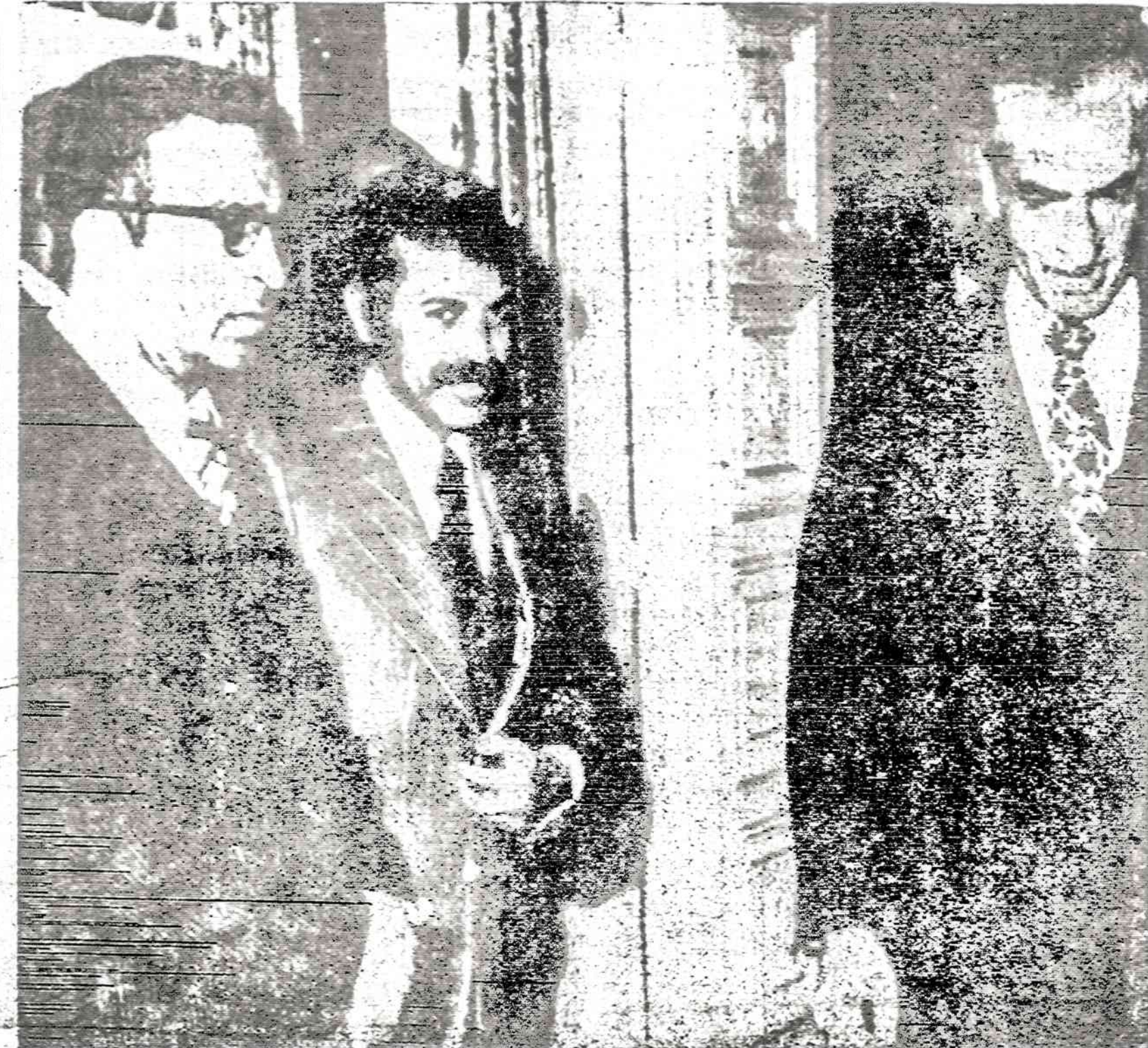
Irano baigėsi kaimyninių valstybių: Irako ir Irano derybos. Kairėje Irako užsienio reikalų ministras Saadedin Hamadi, viduryje Alžiro užsienio reikalų ministras Abdelaziz Bouteflika ir dešinėje — Irano šachas.

WASHINGTONAS. Aleksandras Butterfield pasitraukė iš Federalinės Aviacijos valdybos direktoriaus pareigų. Jis pateko istorijon, nes būdamas Baltųjų Rūmų buvęs saugumo viršininkas, atidengė senato Watergate komitete paslaptį, kad visi pasikalbėjimai Baltuose Rūmuose buvo rekorduojami į magnetofono juosteles.