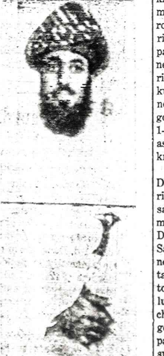
Omano sultonas Quabus bin Said gavo už nafta po bilijoną dol. Į metus, tačiau valdžios išdais dažnai pritrūksta pinigų. Sultonas kartais pasiunčia iėktuvus, kurie mēto visiems Omano vaikams saldinius. Kaimuose gyven-tojai gavo spalvotas televizijas. Apie milijoną gyventojų gauna daugelį valdzios patarnavimų. nemokamai.