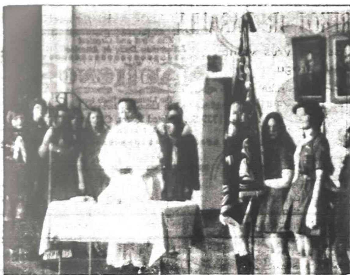
Iš CHICAGOS KERNAVĖS SKAUCIŲ TUNTO VASARIO 16-TOSIOS MINEJIMO

Minejimo pradžia: šv. Mišios Jaunimo Centro didžiojoje salėje.