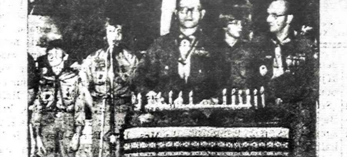
LATVIŲ SKAUTŲ SVENTĖJE CLEVELANDE