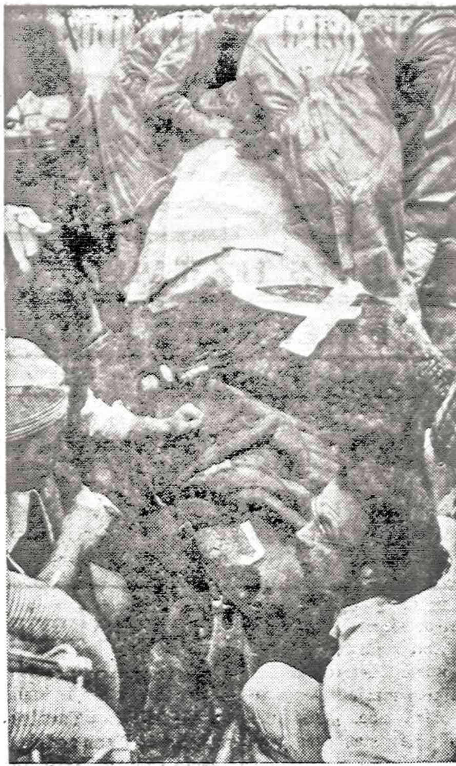
Iowa State universitete Veterinarijos mokykloje buvo padaryta operacija raganosiui. "Pacientas" iš Omaha zoologijos sodo svėrė 5,000 svarų ir jį teko operuoti paguldžius ant žemės.

kitu maistu savo vidurių neperkrauna. Svarbu valgyti pamažu ir dažniau. Vengti visokius aštrumus: keptas, rūkytas, prieskoniais perkrautas valgis. Įprastina laikyti vidutiniškumo visose srityse. Jei šiai tiesai nusižengsime — veltui tabletes stengsimės savo maisto girtas taisyti. Kentėsime patys ir kentės mūsų kišenė. Tada pradėsime varstyti Health Food krautuvų duris, jose trigubai brangiau už niekus mokėdami ir savo sveikatą toliau alindami. Tai baigus nesiorientuojančiųjų elgesys. Niekas mėginsime savo sveikatą ramstyti, pinigų neteksime niekam juos išleisti ir nuolat silpnumu skūsimės, su kumutėmis sava nedalia guosimės. Anos, juk viską žino. Doktorai — ką ten jie — nieko neįsmano. Jos tik vienos iš savo patirties patarimais apipils lengvatikius. Na, taip ir smuksime vis gilesnėn nesveikatos duobėn per sąvalę, arsilėidimą. Gana tokios sąvaliudybės per savo asmenybės nesuorganizavimą.