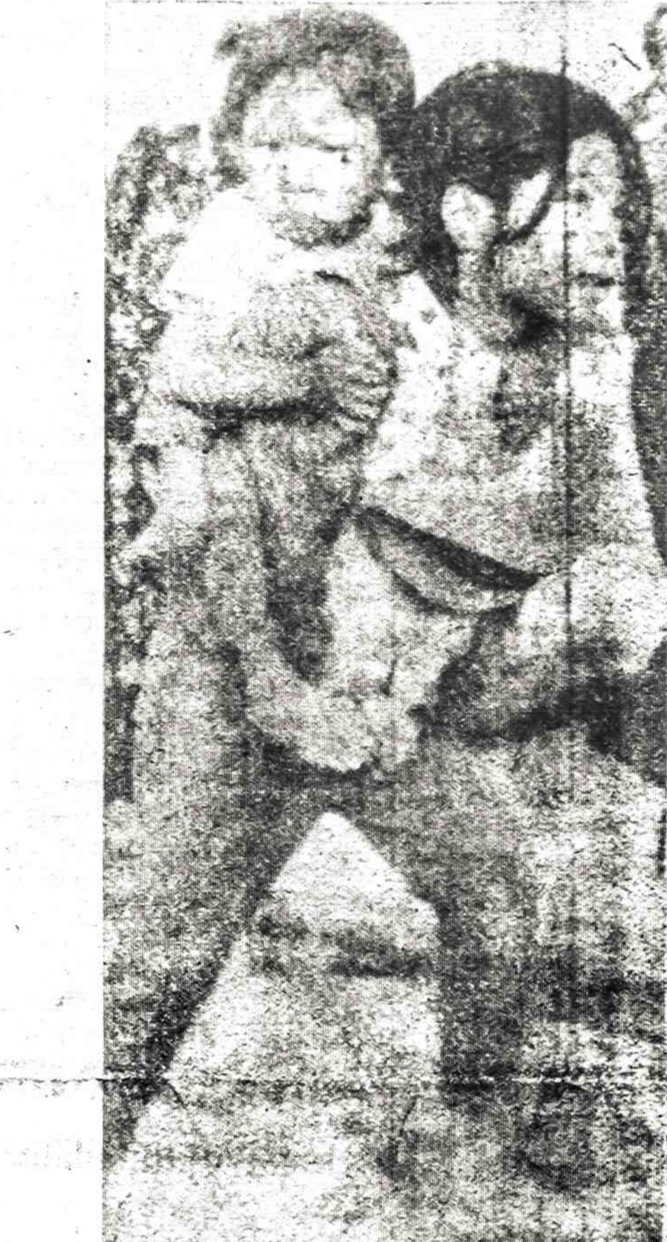
Pietų Vietnamo vyriausybės kariuomenės frontui sugriuvus, į pietus nuo komunistų bėga tūkstančiai žmonių. Čia matoma mergaitė neša savo jaunesnį broliuką.

Šis skridimas irgi buvo skirtas pasiruošti bendram su amerikiečiais skridimui šią vasarą. Kaip paprastai, sovietai apie šio skridimo planus nieko iš anksto neskelbė, nors vakarų mokslininkai įspėjo, kad yra ruošiamas naujas skridimas.