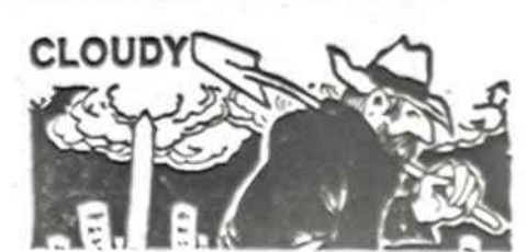
Debesuota, gali lyti; dieną 60°, naktį 45°. Saulė teka 6:09, leidžiasi 7:32

HONOLULU. — Buvęs Kambodijos prezidentas Lon Nol buvo priimtas į armijos ligoninę Honolulu mieste tyrimams ir gydymui nuo jo 1971 m. pergyvento paralyžiaus.