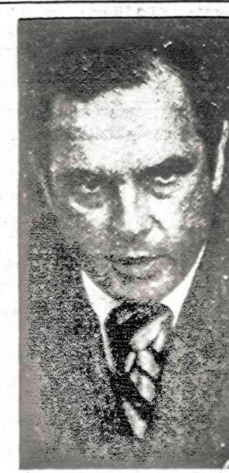
Alexander Butterfield 13 mėn. vadovavo Federalinei Aviacijos administracijai. Jis buvo tas žmogus, kuris pirmas atidengė senato Watergate komitetui, kad Baltuosiuose Rūmuose yra rakorduojami juostelės visi prezidento pasikalbėjimai. Tuo iš žymiai pagreitino prezidento Nixono pasitraukimą.

Didelį pasipiktinimą komunistų tarpe sukėlė Bonos gynybos ministro Georg Leber, socialdemokrato, straipsnis "Vietnamas ir mes". Straipsnyje jis rašo, kad vienintelė koegzistencija tarp komunizmo ir laisvo pasaulio įmanoma ten, kur komunizmas nesijaučia pakankamai stiprus primesti savo ideologiją. Perna V. Vokietijos prekyba su Sovietų Sąjunga pasiekė 3.5 bil. dol., kas yra dvigubai daugiau už 1970 m. prekybą, tačiau prekybos pagyvėjimas neatnešė nuoširdesnių santykių.