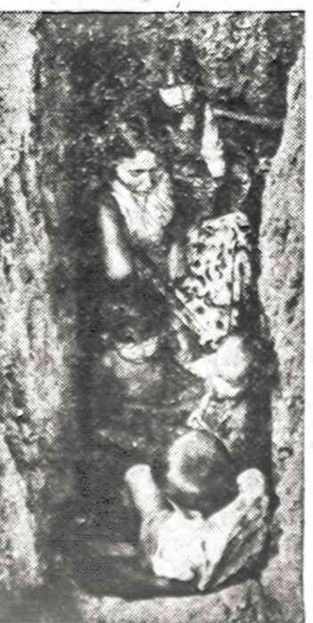
Phnom Penhe gyventojai Kambodijoje ilgas valandas praleidžia apskose ir duobėse, besisaugodami komunistų artilerijos sviedinių.