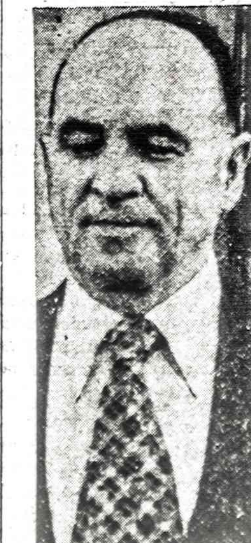
Watergate įsilaizūmis dalyvis James McCord Jr. po visų apeliacijų turėjo pradėti savo kalėjimo bausmę nuo 1 iki 5 metų Allenwood Federaliniame kalėjime, Pensilvanijoje.

Pekine Sihanoukas pareiškė, kad jo motina karalienė Kossomak labai sunkiai serganti, arti prie mirties, ir jis negalys dabar jos palikti Pekine vienos.