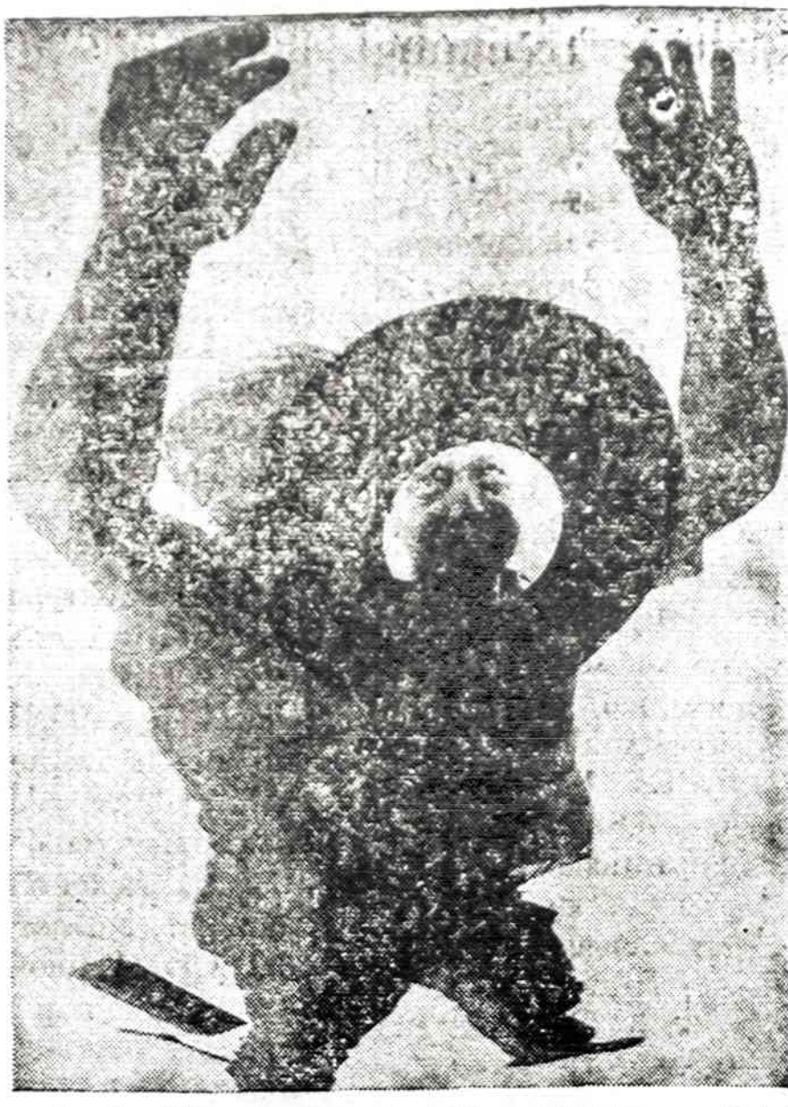
Owens-Corning Fiberglass Corp. technikas apžiūri per patikrinimo skylių lenktą šikto gabalą, kuris dengs Santa Clara universiteto Kalfornijoje pastatą. Šis stiklinis stogas yra 310 pėdų ilgio ir 210 pėdų pločio.

Mes turime gana pavyzdžių. Sakysim dabartiniai įvykiai Portugalijoje. Sakysim, mūsų alseikos ir kiti. Šitie nauji alseikos, šitie nauji Trojos arkliai turi su griauti vakariečių sistemas, o išvažiuojimus, kurie nespės miruti, imperialistinis Sovietų Rusijos komunizmas pasivys. Toki yra tikri velniški Maskvos planai. Agentai paskleidžiami ne-