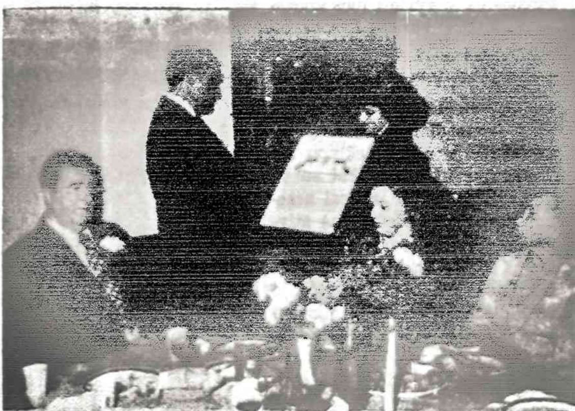
St. Jokubaičiui įteikiamas adresas.

svarbios mūsų lietuviškos įstaiigos. Jo dėka ir tautinių šokių grupė "Atžalynas" gavo $1,200 pašalpą iš Kanados Federalinės valdžios. Vakarinėje Toronte miesto dalyje — Glenlake ir Keile gatvių kampe jo ryšii dėka gautas "Park Lithuania" pavadinimas. Kitos žymiai gausesnės etninės grupės neturi savų parkų, o lietuviai turi.