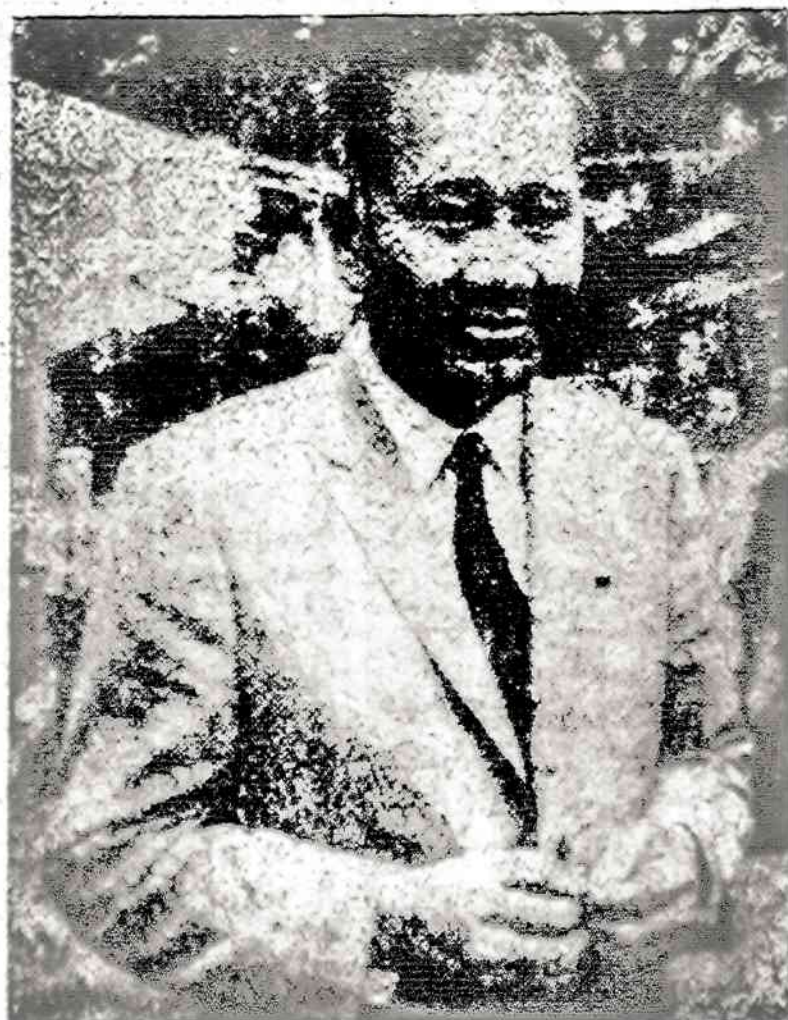
Paskutinis laisvojo Pietų Vietnamo prezidentas gen. Duong Van Minh, kuris tikėjosi derybų su komunistais, bet buvo priverstas pasiduoti jiems be jokių sąlygų.

Saulėta. Dieną 70°, naktį 55° Saulė teka 5:42, leidžiasi 7:53