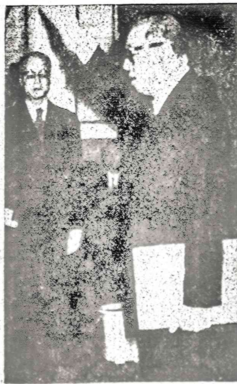
Tautinės Kinijos viceprezidentas C. Yen prisiekia, perimdamas prezidento pareigas, generalisimui Chiang Kai Shekui mirus.

NEW YORKAS. — Coca Cola bendrovė per pirmą šių metų ketvirtį padidino savo pelną 15%, pelno būta 47 mil. dol. Gėrimų parduota už 650 mil. dol.