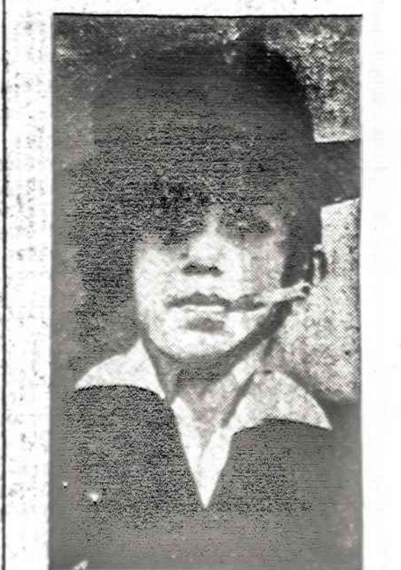
Jauna haizų bėdy bendruomenės narė New Yorke valdina daug mažiųjų moterų, tačiau jos cigaretė neuzdegtą.

— Amerikos Lietuvių Tautinės S-gos seimas įvyks gegužės 24 ir 25 d. Clevelande. Suvažiuos atstovai ir svečiai iš visos Amerikos.