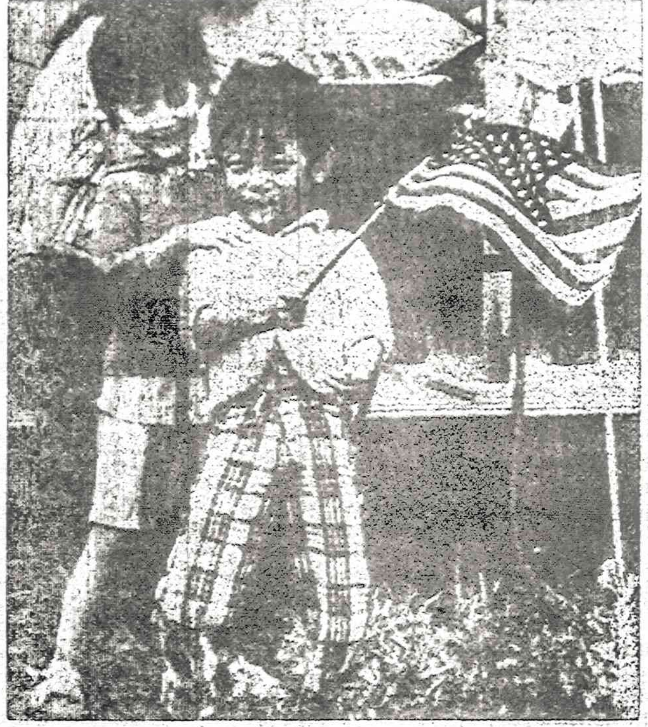
Du nauji amerikiečiai, Vietnamo pabėgėliai; žaidžia Eglin aviacijos bazėje, Floridoje.

Laoso komunistai pasidarė dar įžulesni ir atvirai siekia savo tikslų.