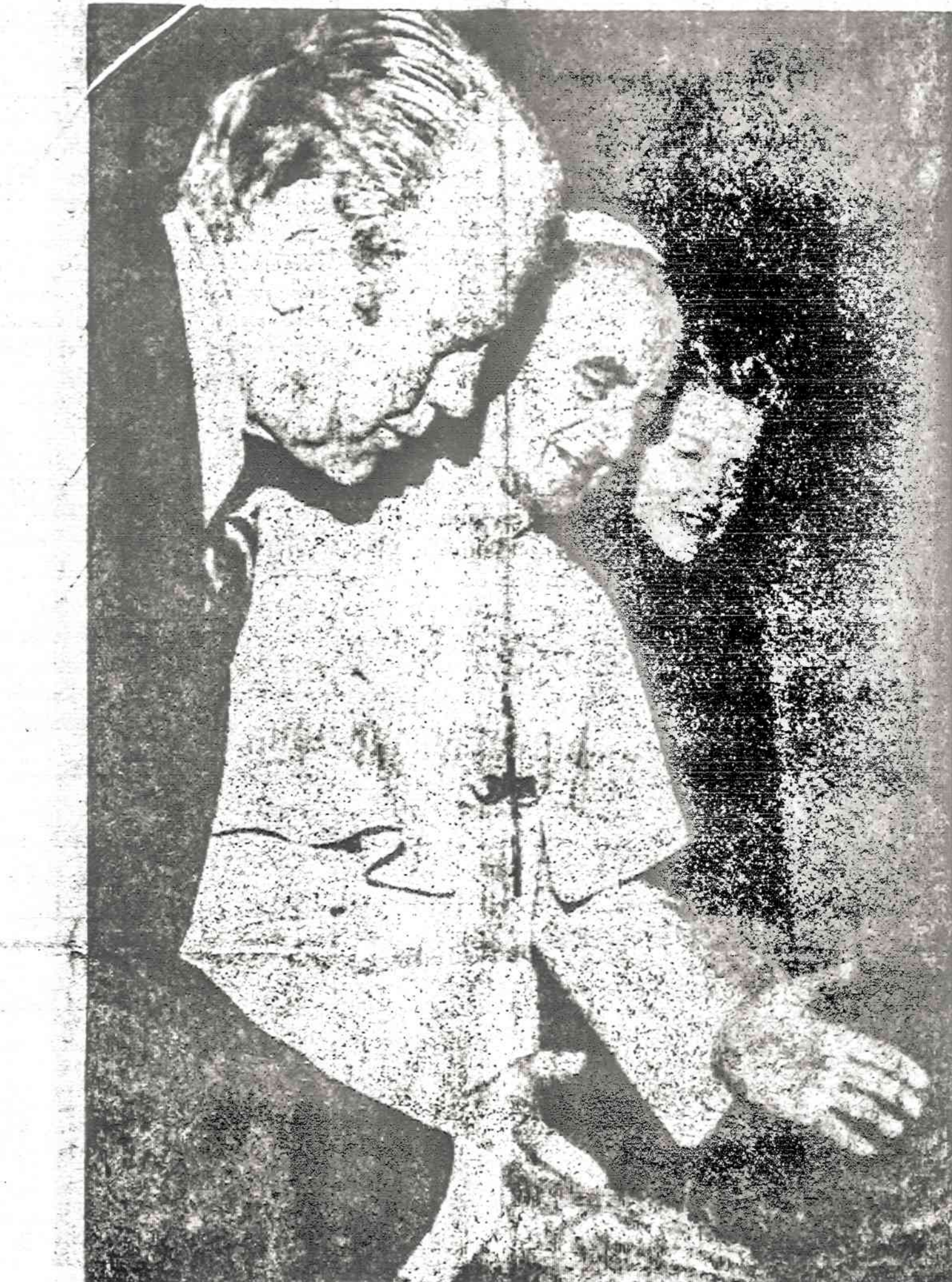
Prezidentas Fordas, būdamas Romoje, praleido virš valandos su Popiežiumi Pauliu. Buvo pasikeista dovanomis, kurias nuotraukoje abu apžiūri. Už Popiežiaus matyti ponija Betty Ford. Prezidentas padovanojo Popiežiui oro skulptūrą, o gavo dovanų Vatikan, Romos ir Tiberio upės barjelijetus.