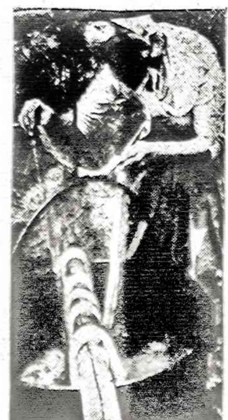
Ši moteris demonstruoja Croton-on-Hudson, N. J. Gkyje, kaip senovėje moterys dažydavo avies vilnas svogūny laišku virale.