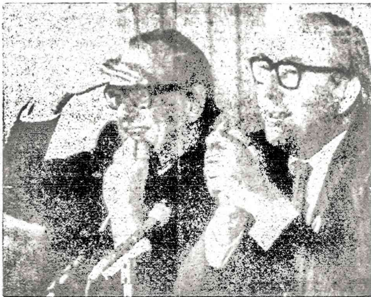
Nors dviejų priešiškių partijų atstovai: Reginald Maudling, kairėje, konservatorius ir Roy Jenkins, dešinėje, abu ragino balsuotojus spaudos konferencijoje pasisakyti už Britanijos palikimą Europos Bendroje Rinkoje. Referendumas Britanijoje įvyko birželio 5 dieną.

◆ Saigone uždaryti visi bankai, kurių buvo 24, iš jų 14 priklauso užsienio interesams.