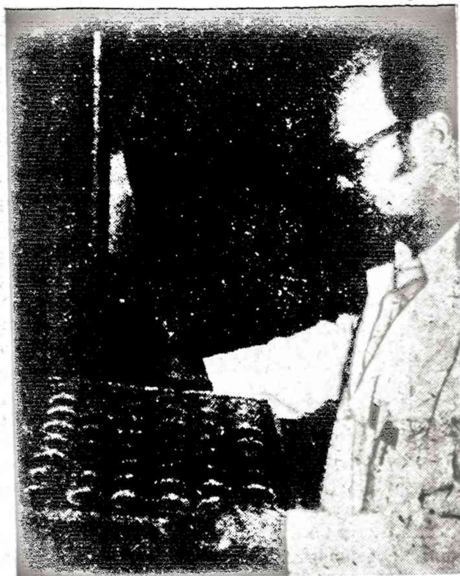
San Francisco JAV pinigų lietykloje panaudotas naujas būdas pinigams tikrinti. Naujai iškalti pinigai įkrenta į specialius rėmus, kuriuos apvertęs inspektorius gali patikrinti abi pinigų puses, nečiuo pinėdamas pinigų rankomis.

◆ Vatikano laikraštis pabrėžia, kad Italijos komunistai, nors ir nuosakūs, vis vien įvestų diktatūros režimą Italijoje.