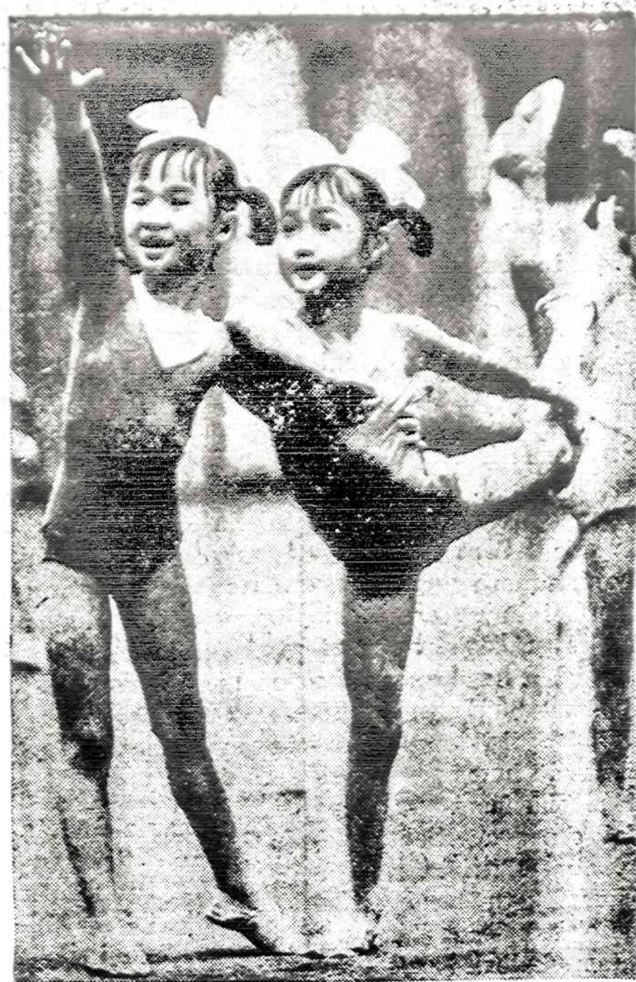
Jaunos balerinos Pekino Nr. 5 mokykloje. Kinijos vaikai pradeda baletą pamokas jau vaikų darželyje, sakoma kinų propagandos paaiškinime.

Klubas šiandien turi jau per 80 savo narių, didelę dalimi vis žinomų vardų veikėjų. Tiesa, ne visi jie yra reikiami aktyvūs, bet didelė dauguma klubo narių yra gyvos iniciatyvos, aktyviai dalyvauja klubo darbuose: kelia konstruktyvias idėjas, sugestijas susirinkimuose, rašo klubo tur-