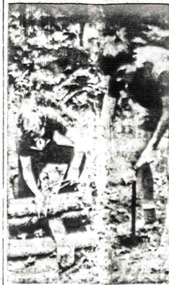
PIONIERIŲ DARBAI STOVYKLOJE