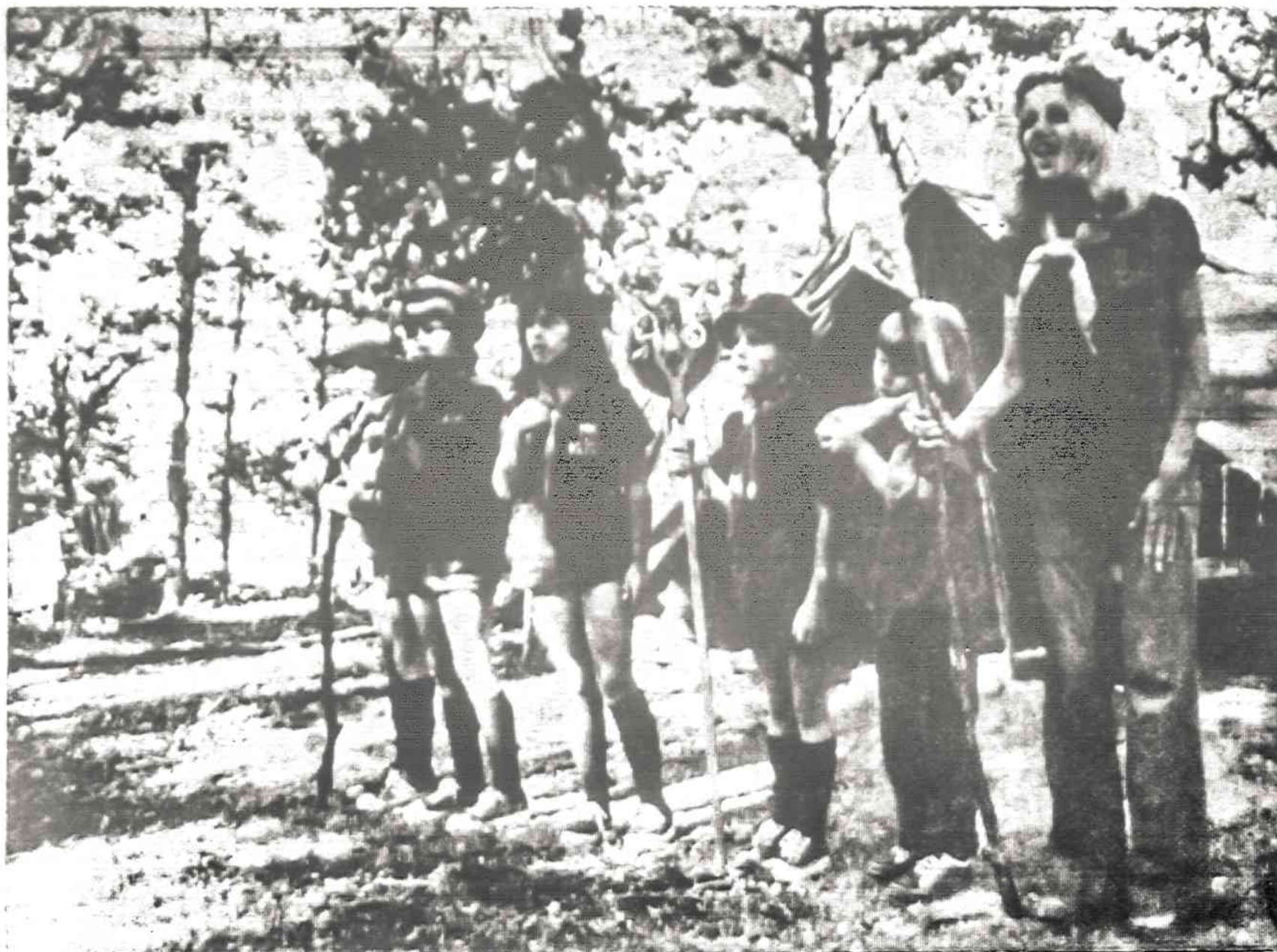
PIRMAJĄ STOVYKLAVIMO DIENĄ SUTVARKIUSIOS PALAPINES (taip pat ir savo seses — paukštynes), jauniausios vadovės laukia inspekcijos.