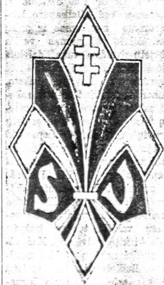
SKAUTO VYČIO ŽENKLELIS (bent dešimt kartų padidintas). Jį gauna vyresnieji jaunuoliai, dave skauto vyčio įžodį.

ne visi moka lietuviškai, ir reputacijos atliekamos anglų kalba.