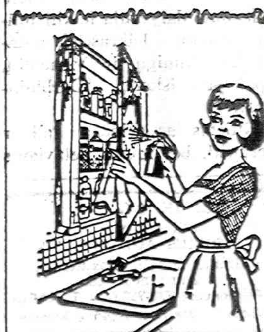
Savo namie vaistų spintelė reikia nepaprastai svariai ir tvarkingai užlaikyti, kaip šiame vaizdelyje parodyta: išimti visas bontunes ir nuaplauti lentynas; patikrinti visus užrasus, kad neįvyktų klaidų, nes vaistų sumaišymas gali būti fatališkas. Patikrinti, kokiu vaistų frūktu ir juos papildyti, kad būtų bet kokiam netikėtumui pasirodes.

SKAITYK IR KITAM PATARK SKALTYTI "NAUJENAS"