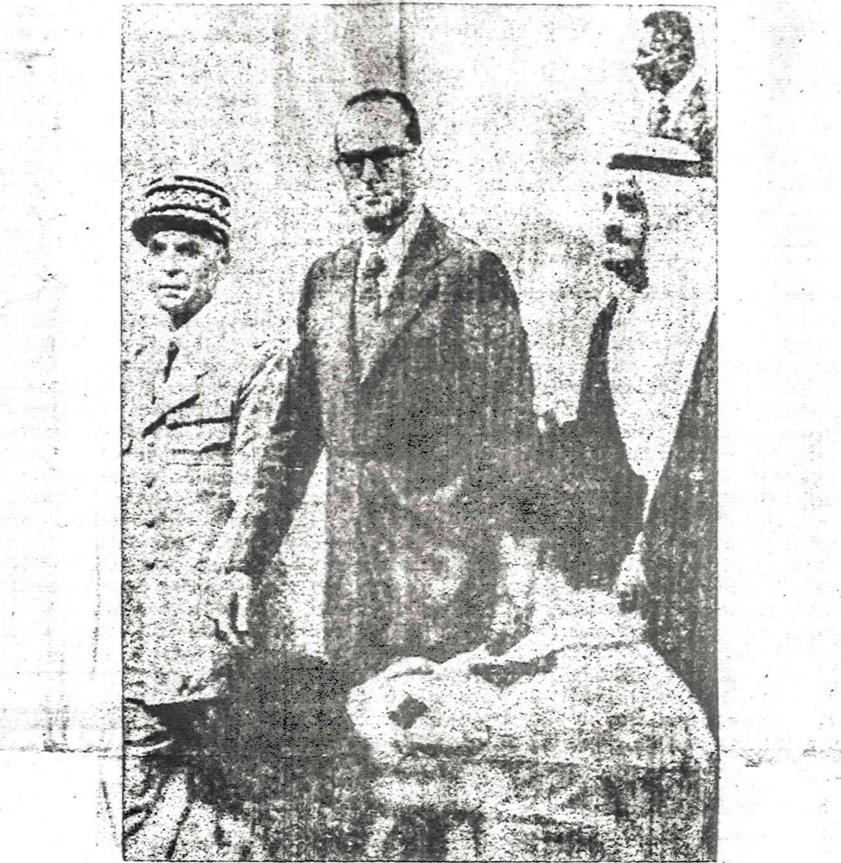
Saudi Arabijos sosto įpėdinį princą Fahdą Prancūzijoje pasitiko premjeras Jacques Chirac (viduryje). Princas keturias dienas aptarė su prancūzų vyriausybe politinius ir ekonominius abiejų valstybių santykius.

HYANNIS PORT. — Ponia Rose Kennedy antradienį šventė savo 85 gimtadienį. Šį šeštadienį visa šeima suvažiuos į gimtadienio balių.