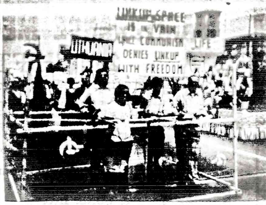
Nėra jokios prasmės su rusais susitikti erdvoje, jeigu su jais negalima susitikti laisvėje, — sako lietuvių vaikų paruoštas apšviestas gardas, kurio vienas keturias savaites sauge sovietinis ptautuvas ir raudonarmėtis su ginklu. Gardas su kaliniiais buvo rodomas 1975 m. liepos 19 dienos eisenos metu Chicago didmiesčio.

Mokytojų kambario po vienu buvo tardomi mokiniai Bakutis, Razmanavičiūtė ir dvi seserys Jezenskaitės dėl rengimosi Pirmajai Komunijai 1971 m. vasarą... Mokiniams buvo pateikti klausimai: ar klebonas mokė? Kiek laiko mokė? Ką mokė?... Vaikai buvo tardomi maž-