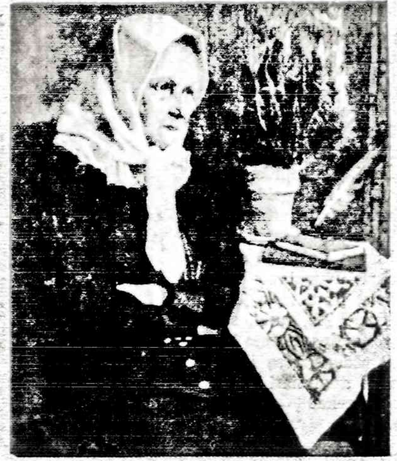
Rašytoja JULIJA ZEMAITĖ