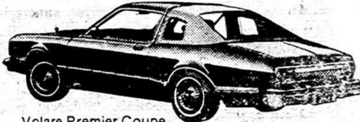
Volare Premier Coupe

Seniausias automobilių pardavėjas lietuvis