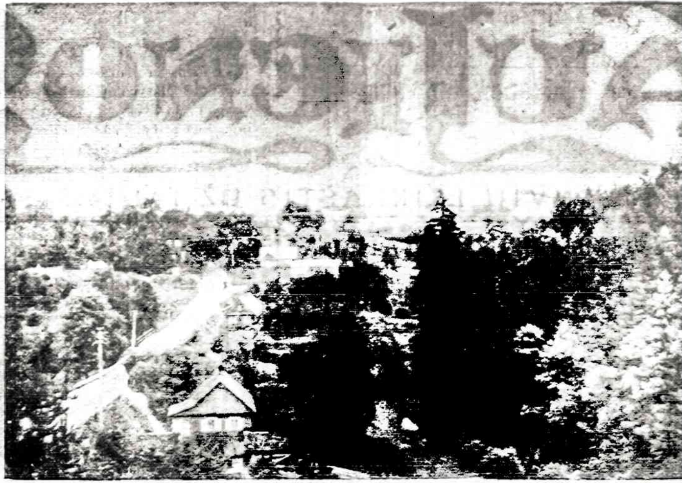
Vilniaus užmiestis pasakiškai gražus, matome Vėrkų priemiesatį

Taciau Amerikos lietuviai nerimo, daugelis jų bandė kaip nors per Vakarų Europą, per kokius nors pažįstamus bent laiškais susisiekti giminėmis. Vietnam kitam retkarčiais pavykdavo. Bet labai daug jų bombardavo savo laiškais lietuviškų laikraščių redakcijas, kad tos darytų ką nors, kad ieškotų kelio, kuriuo būtų galima susisiekti