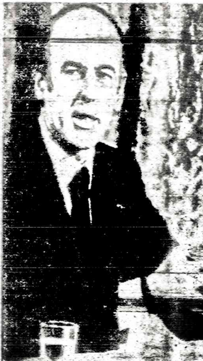
Prancūzijos prezidentas Giscard d'Estaing labai šiltai pasitiko atskridusį prezidentą Carterį ir aptarė finansinius bei šiuores Atlanto valstybių sąjungos gynybos reikalus. Vakar Amerikas prezidentas jau buvo Belgijos sostinėje.

LONDONAS. — Londone ir Briuselyje tuo pačiu metu sprogdintios bombos prie pastačių, kuriuose veikė Turkijos bankai ir kt. finansinės įstaigos. Atsakomybę už abudu bombardavimus prisimė viena armėnų pagrindinė organizacija — "Naujoji Armėnų Rezistencija". Nuo stojų žmoniškis nebuvo, tik daug laisvų šūkių.